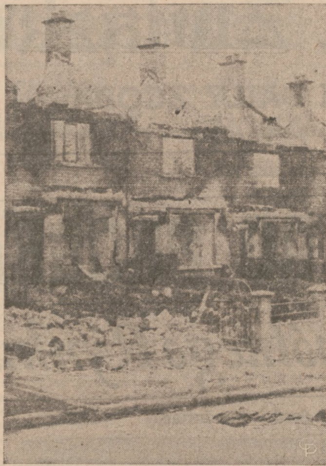
W POŁNOCNEJ IRLANDII, protestanci opuszczając zagrożone dzienne palą swoje domy, żeby nie mogli w nich zamieszkać katolicy. Na zdjęciu: szkielety zniszczonych domów w Belfast. Innym miastem gdzie dochodzi do gwałtownych starć katolików i protestantów jest Londonderry.

Pierwsza suma pieniędzy pozwoli na razie na zatrudnienie tylko 7 policjantów po 871 dol. pensji na miesiąc. Około 1 września gdy wpłynę więcej pieniędzy, znowu pewna liczba pracowników zostanie powołanych.