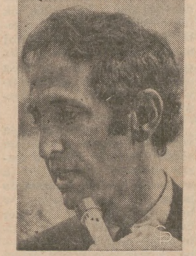
DANIEL Ellsberg (na zdjęciu) dwukrotnie oświadczył w sądzie w Los Angeles, że jest niewinny wobec stawianych mu zarzutów narażenia bezpieczeństwa kraju poprzez wydanie do publikacji dokumentów Pentagonu. Proces będzie kontynuowany w przyszłym roku. Ellsberg oświadczył, iż oprze swoją obronę na cywilnym prawie przywileju obywatela, który ma prawo wydzierać o poczynaniach Pentagonu.