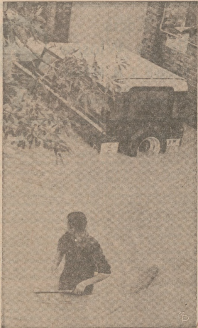
NAD HONG KONGIEM przeszedł niedawno niezwykle silny tajfun, największy w ciągu ostatnich dziesięciu lat, który sparaliżował normalne życie brytyjskiej kolonii gdzie żyje 4-ry miliony ludności. Na zdjęciu: jedna z ulic Hong Kongu zalana wodą.

Rozmowy między przedstawicielami grupy Indian, która obecnie okupuje opuszczoną jednostkę wojskową, i władzami federalnymi będą kontynuowane. Delegat Indian na te rozmowy, John J. Ladner jr., również radca prawny Indian, oświadczył, że obecne stadium negocjacji napawa optymizmem. Federalne agencje, które biorą udział w negocjacjach z Indianami to: Department of Health, Education i Opieki Społecznej, Dept. Gospodarki Mieszkaniowej i Rozwoju Miast, Dept. Pracy, Dept. Transportu oraz Urząd Ekonomiki Zatrudnienia.