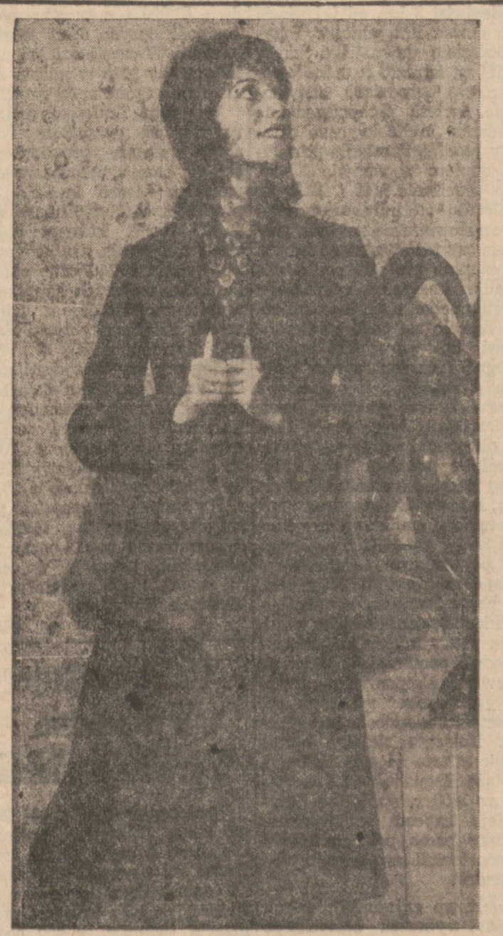
Elegancki i wygodny kostium wełniany; suknia bez rękawów i żakiet.