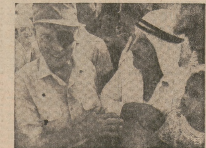
MOSHE DAYAN, izraelski minister obrony, w czasie wizyty w miejscowości Natanya, gdzie zamieszkuje ludność arabska.