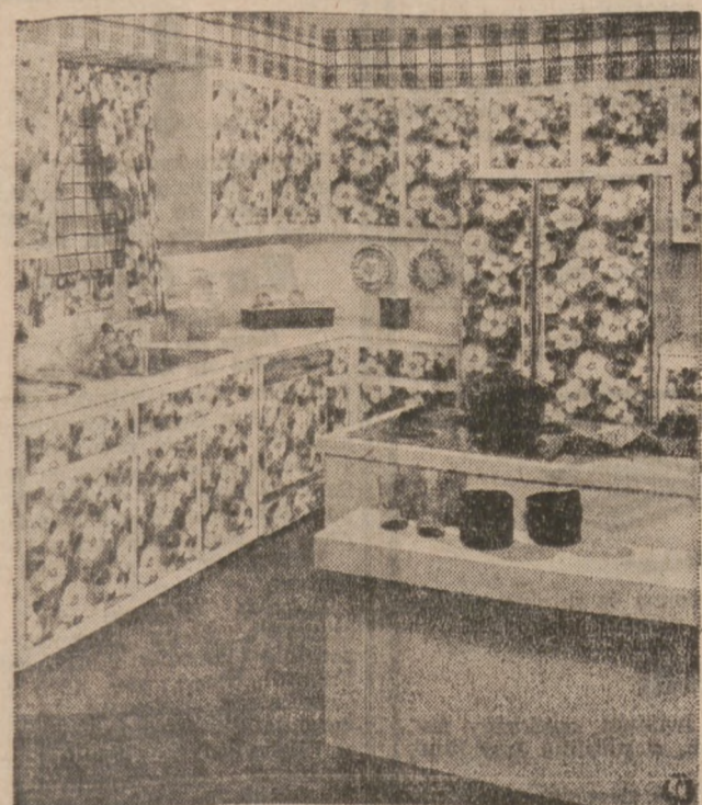
IN THE KITCHEN—Bright cotton fabrics give the kitchen a touch of springtime all year round. Flower-printed cotton in green, white, and black is used for short draperies and decorative panels on cabinet doors, dishwasher, refrigerator, and wall oven. Adding another dimension to the room scheme is the use of a color-coordinated cotton plaid on the soffit and window shade. The Waverly fabrics are treated with Scotchgard for protection against grease and stains. Featured in McCall's You-Do-It Decorating Magazine.

All Chicago Park District outdoor pools will close for the season Labor Day, Monday, September 6, at 9:00 p.m. From Labor Day until Wednesday, September 15th, at 9:30 p.m. the 15 major beaches will remain open on a restricted basis, announced Thomas O'Brien, general supervisor of beaches and pools.