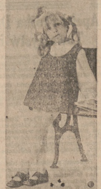
Bluzeczka z długimi rękawami i deseniowy bezrękawnik z bawełny (cotton) — komplet dla dziewczynki.

Nie należy krochmalic bieleziny, która ma być przechowywana aż do następnej wiosny. Mięso do pieczenia, zamoczone na kilka minut w letnim mleku będzie rumiane i soczyste po upieczeniu. Dobrze zmięta gazeta jest doskonałym środkiem do czyszczenia luster i okien. Obraćciane dywanów w inną stronę jest korzystne dla dywanów. Zużywają się wówczas równomiernie i dłużej trwają. Na gładkich dywanach bez deseni odznaczają się wszystko więcej niż na dywanach w deseni.