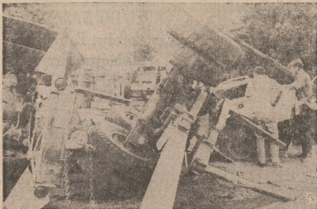
TRAGICZNY WYPADEK drogowy miał miejsce w Corvallis, Ore., gdzie samochód osobowy zderzył się z ciężarówką z przyczepą. Matka oraz jej dwaj synowie, bliźniaki, ponieśli śmierć. Trzy inne osoby zostały ranne. Samochód osobowy przejechał znak drogowy, nakazujący zatrzymać się.