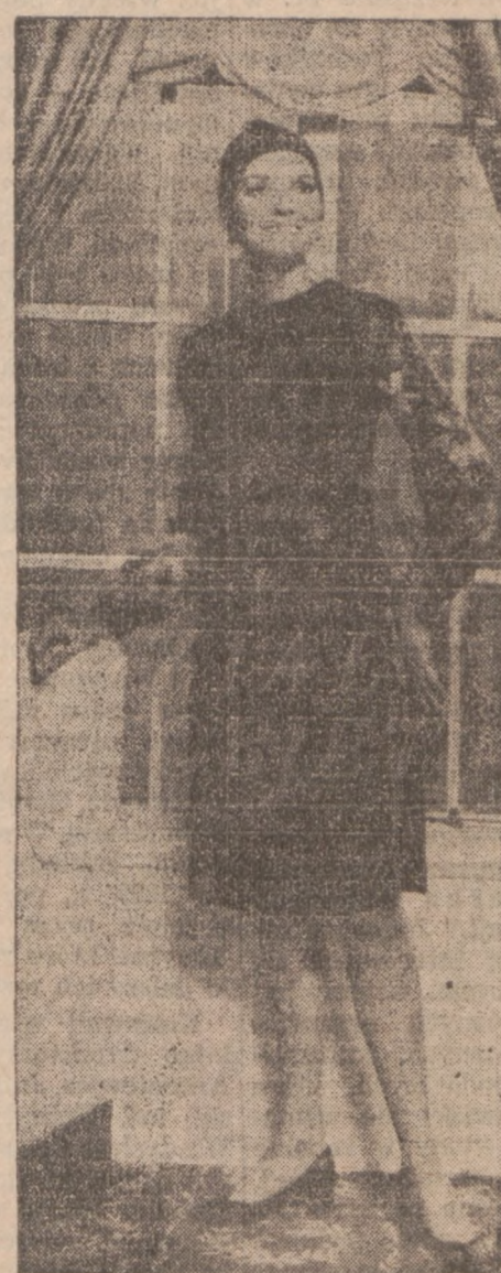
Wełniana tunika i szorty (hot pants) model Pierre Cardin.