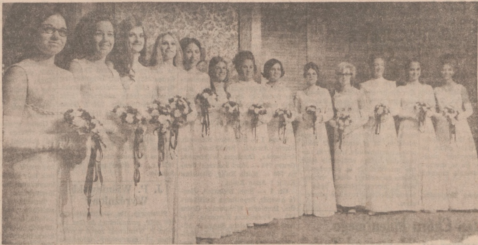
NA ZDJĘCIU POWYŻSZYM: 13-SKIE DEBIUTANTEK, AMERYKANEK POLSKIEGO POCHODZENIA.

Bal Debiutantek Klubu Kulturalnego Pań "Polanki" Wielkim Wydarzeniem Towarzyskim