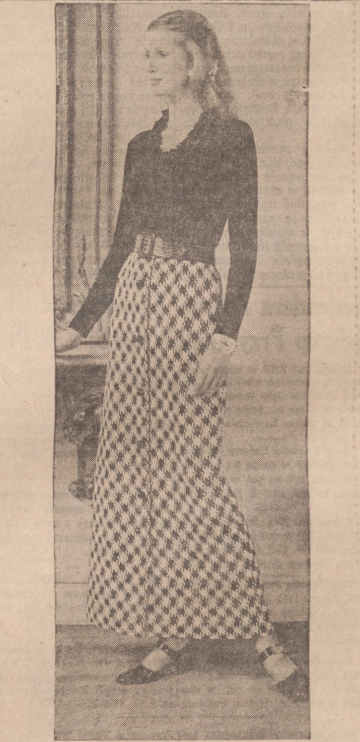
Efektowny strój popołudniowy — spódnica w kratkę czarno-białą z orlonu i kaszmirowy sweter w czarnym kolorze.