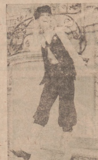
Spodnie i kamizelka z bawełnianego aksamitu w kolorze czarnym, biała bluzka.

Powyższe i temu podobne slogany nie mają nic wspólnego z istotnym równouprawnieniem, o jakie walczyły pierwsze emancypantki. Odpowiedzialne stanowisko nie przeszkadza kobiecie do pełnienia obowiązków dobrej żony i troskliwej matki. Jeżeli ma ku temu odpowiednie warunki finansowe i może pozwolić sobie na pomoc domową, sytuacja jest znacznie lepsza. Są jednak i takie, które pracując zarobkowo czy zawodowo, znajdują czas na wszystko i nie żądają od męża zmywania talerzy czy prania pieluszek.