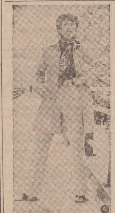
DOWN TO EARTH—Dressing in layers is both stylish and practical this season. Benson & Partners shows how it's done with fashionable flair in this all-cotton ensemble with a military air.