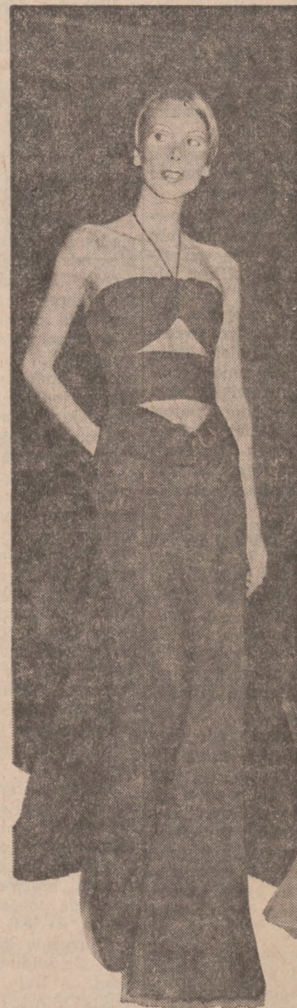
Suknia wieczorowa z jersey w kolorze czarnym, odpowiednia na cieplejszą porę roku.