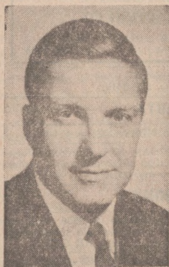
CHARLES A. PERCY

Zbliża się termin Bankietu na rzecz Kolegium Związkowego, coraz więcej wybitnych osobistości przyjmuje udział w Komitecie Honorowym, a równocześnie wzrasta liczba osób i organizacji zakupujących bilety.