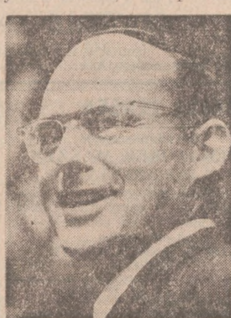
Adlai Stevenson III