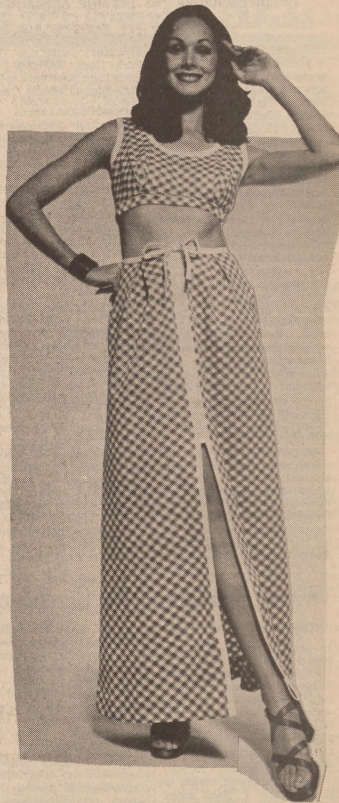
Wygodny komplet letni z bawełny (cotton) w białą-czarną kratkę.