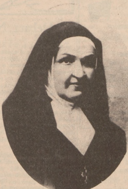
Matka Celina Borzęcka

Matka Celina Borzęcka, obecnie już po przeprowadzeniu Jej procesu beatyfikacyjnego, obdarzona tyt. Służebnicy Bożej, była fundatorką i długoletnią Matką Generalną (1891 — 1913) Zgromadzenia Sióstr Zmartwychwstań Pańskiego. Służebnica Boża, wierna religijnej tradycji polskiej, wniosła w życie zakon i do wszczętej w jego pracę działalności społecznej i trwałe i cenne wartości, oparte na miłości bliźniego.