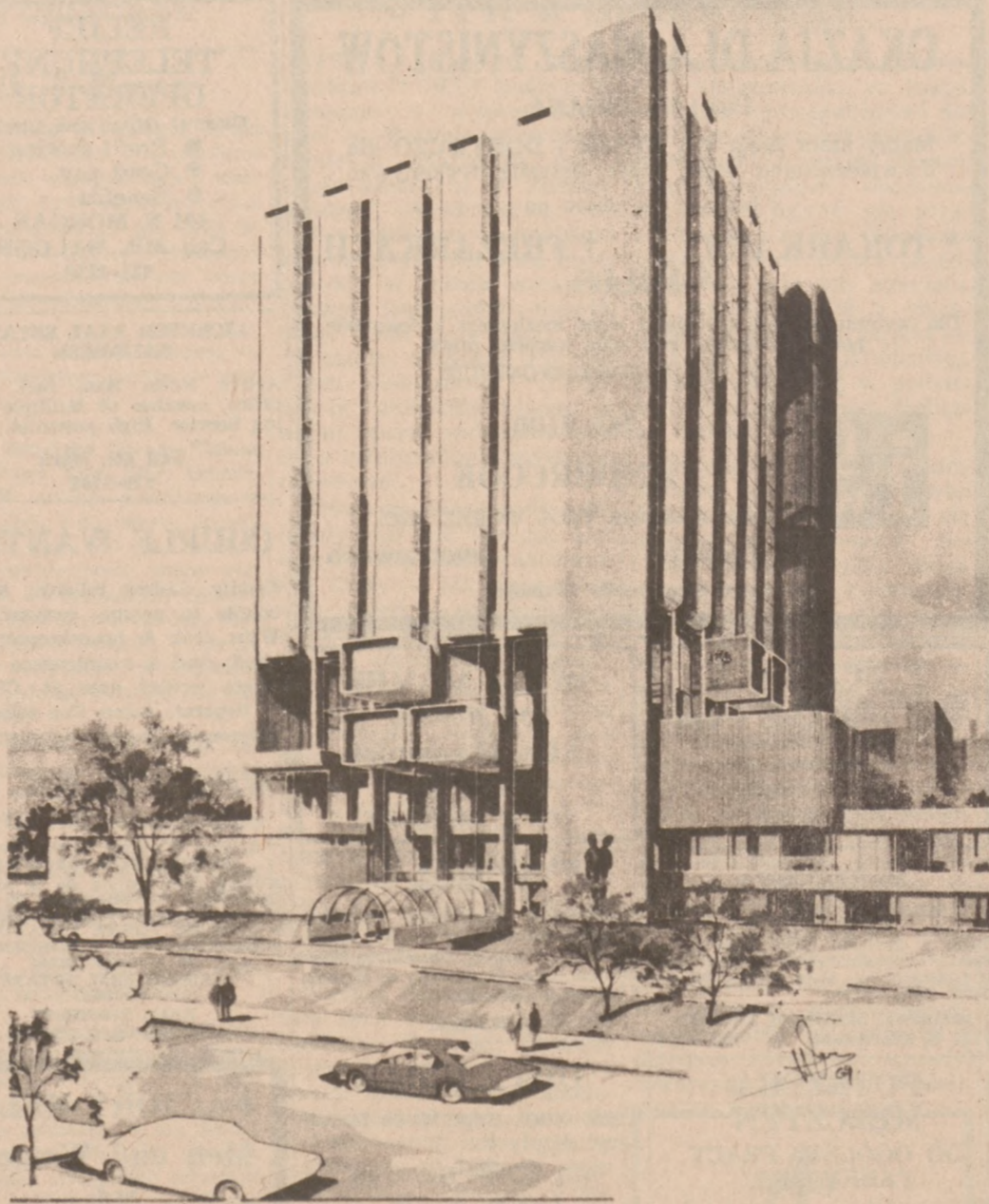
W związku z rosnącym zapotrzebowaniem na opiekę lekarską w Chicago St. Mary of Nazareth Hospital planuje budowę nowego ośrodka służby zdrowia (szkiełko u góry). New Hope, New Health Center, obliczony na 485 łóżek, będzie największą inwestycją w historii szpitala, który powstał w 1894 roku. Większość kosztów inwestycji zostanie pokryta z ofiar i składek na ten cel.