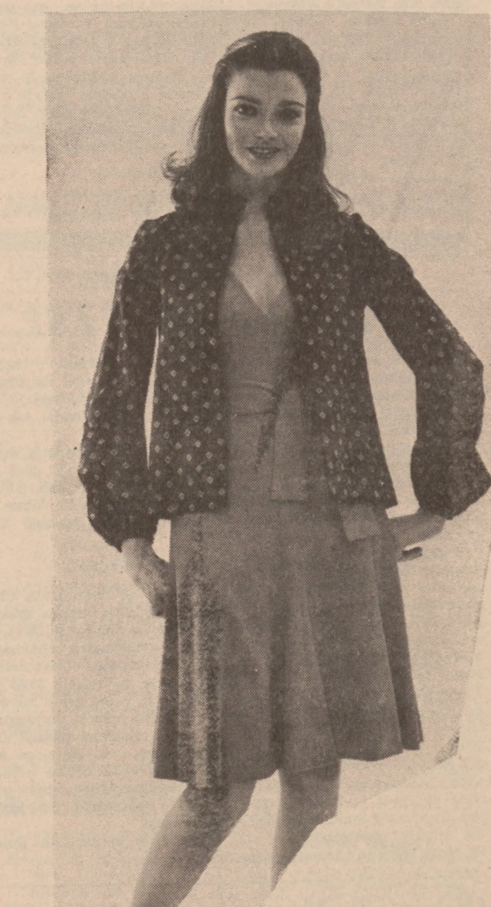
Letnia suknia z bawełny w jasnym kolorze. Luźny żakiet z deseniowego materiału.