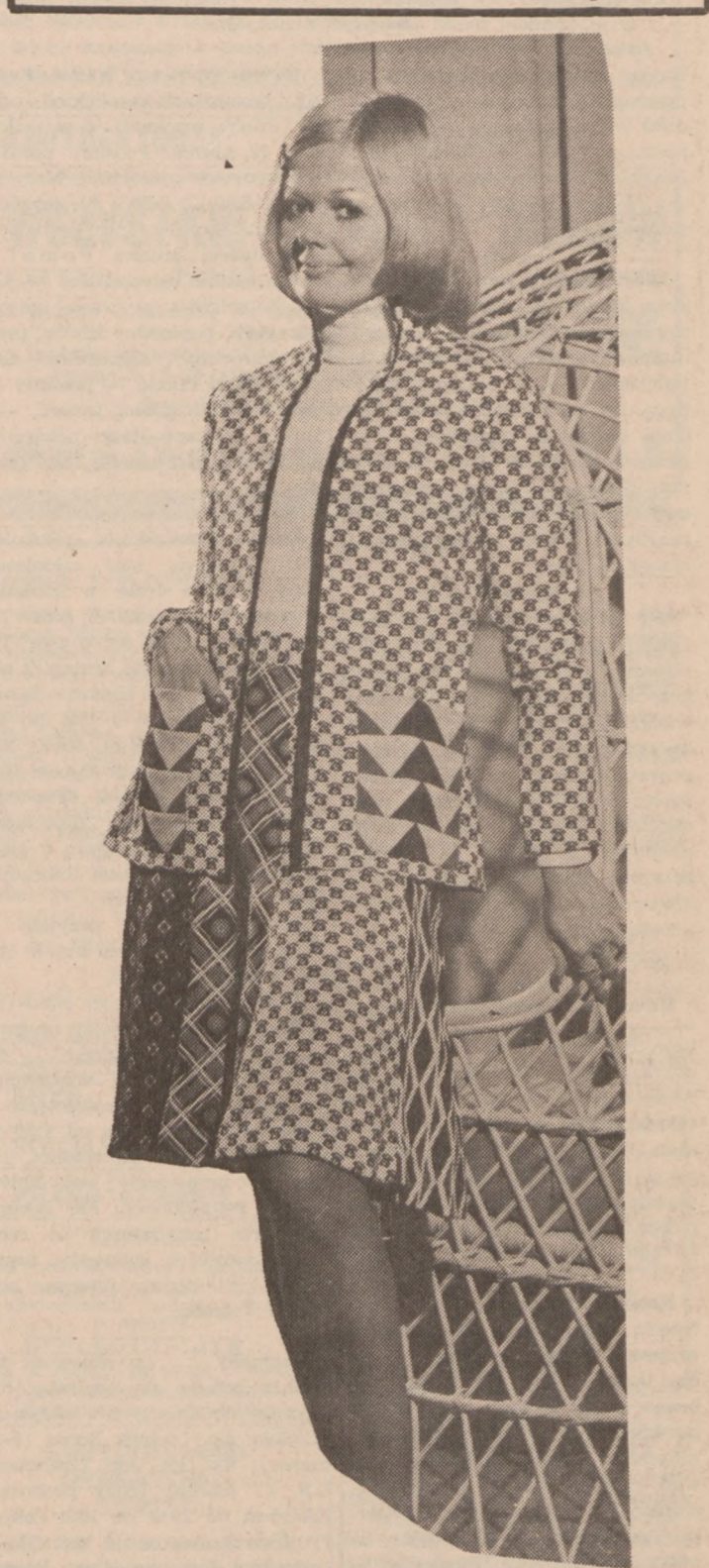
Kostium wiosenny z wzorzystego materiału. Jak widać na zdjęciu spódnica z materiału o 3-ch wzorach.