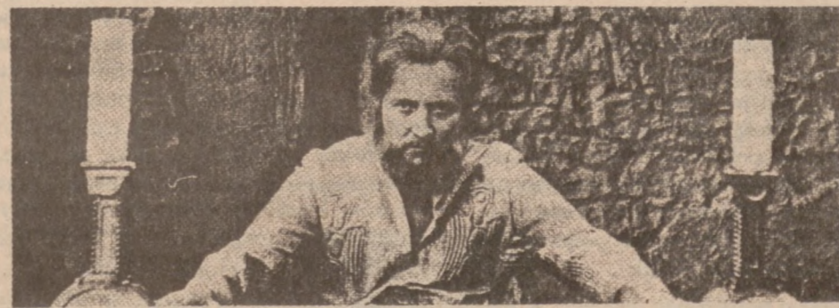
Reżyserii W. LESEWICZA

Udział biorą: J. GOGOLEWSKI, J. KALISZEWSKI, A. ŚLASKA oraz wielu innych. * Po raz pierwszy film polski sięga do najstarszych czasów w ojczyźnię historii. * Zarys i śmierć Biskupa Szczepanowskiego (Św. Stanisława) to jeszcze jeden powód do zobaczenia tego filmu. * Z FILMEM TYM WYŚWIETLAMY DRUGI FILM p.t.