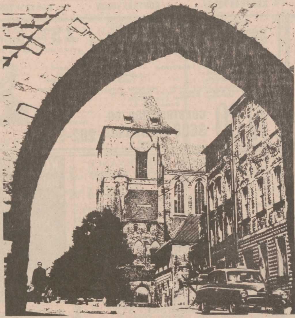
Kościół Sw. Jana w Toruniu, w którym Mikołaj Kopernik otrzymał chrzest.