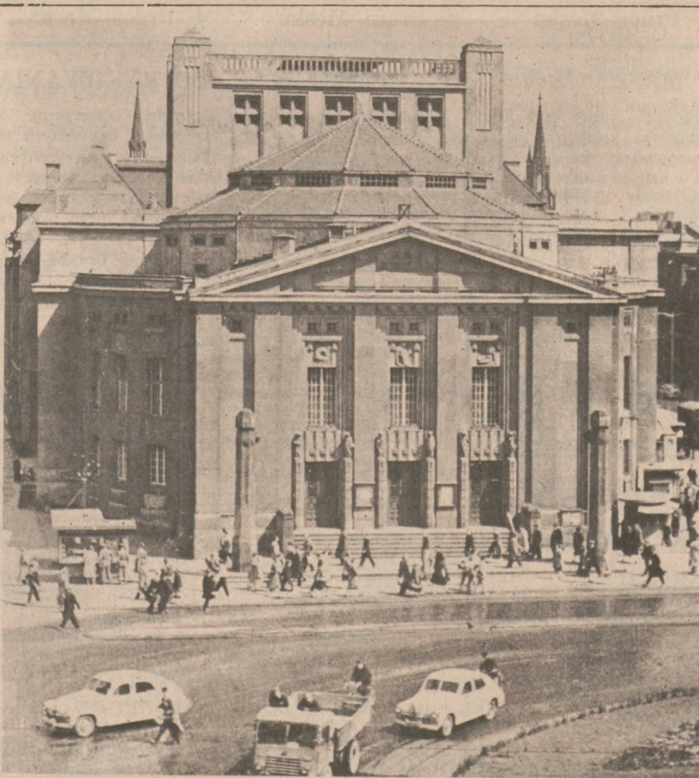
Katowice — Teatr Im. Wyspiańskiego

"Dziennik Związkowy" najlepiej informuje w sprawach polskich swych czytelników jako najwcześniejsze polskie pismo w Ameryce.