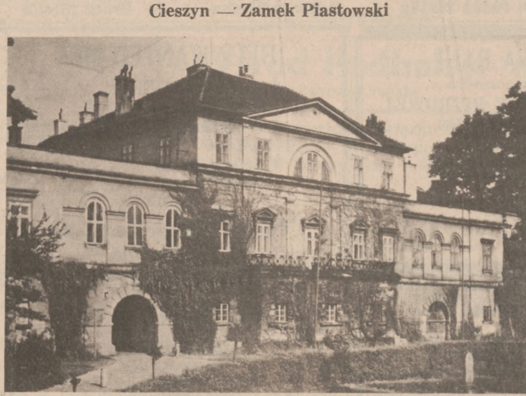
Cieszyn — Zamek Piastowski