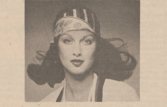
Na zdjęciu dwa modele szalików, zastępujących kapelusze. Nowa ta moda jest wygodna i praktyczna w porze wiosenno-letniej, gdyż chroni uczesanie a jednocześnie zapobiega wysuszeniu się włosów na słońcu.