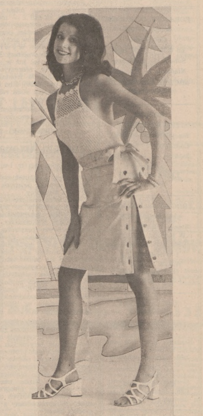
Spódniczka z białego płótna, zapinana na guziki. Stanik z dzianiny w kolorze białym. Strój letni, odpowiedni dla młodej osoby.