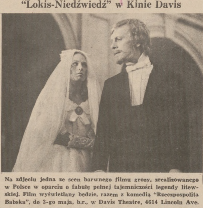
"Lokis-Niedźwiedz" w Kinie Davis Na zdjęciu jedna ze scen barwnego filmu grozy, zrealizowanego w Polsce w oparciu o fabułę pełnej tajemniczości legendy litewskiej. Film wyświetlany będzie, razem z komedią "Rzeczpospolita Babska", do 3-go maja, b.r., w Davis Theatre, 4614 Lincoln Ave.

30 maja 1915 — w parku Humboldt w Chicago pod pomnikiem Kościuski odbyła się wielka manifestacja polska z udziałem Ignacego J. Paderewskiego.