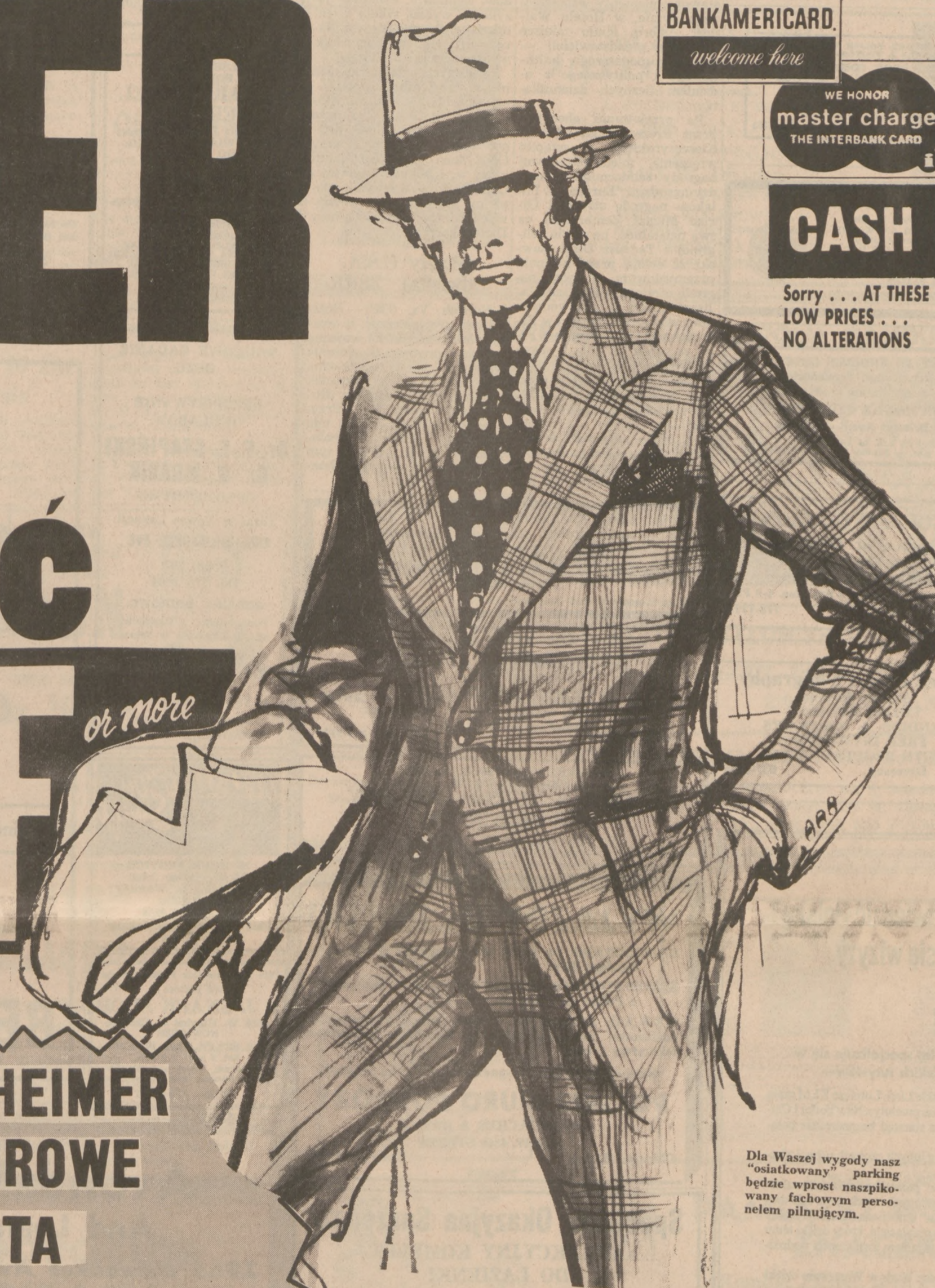
Dla Waszej wygody nasz "osiatkowany" parking będzie wprost naspikowany fachowym personelem pilnującym.

Sorry... AT THESE LOW PRICES... NO ALTERATIONS