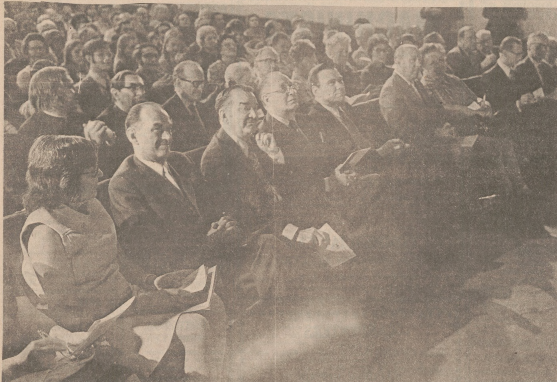
Fotografia zgromadzenia w amurywskie pomieszczenia restauracji w Waszyngtonie w dniu wydania znaczka na cześć Mikołaja Kopernika, 25 kwietnia br.