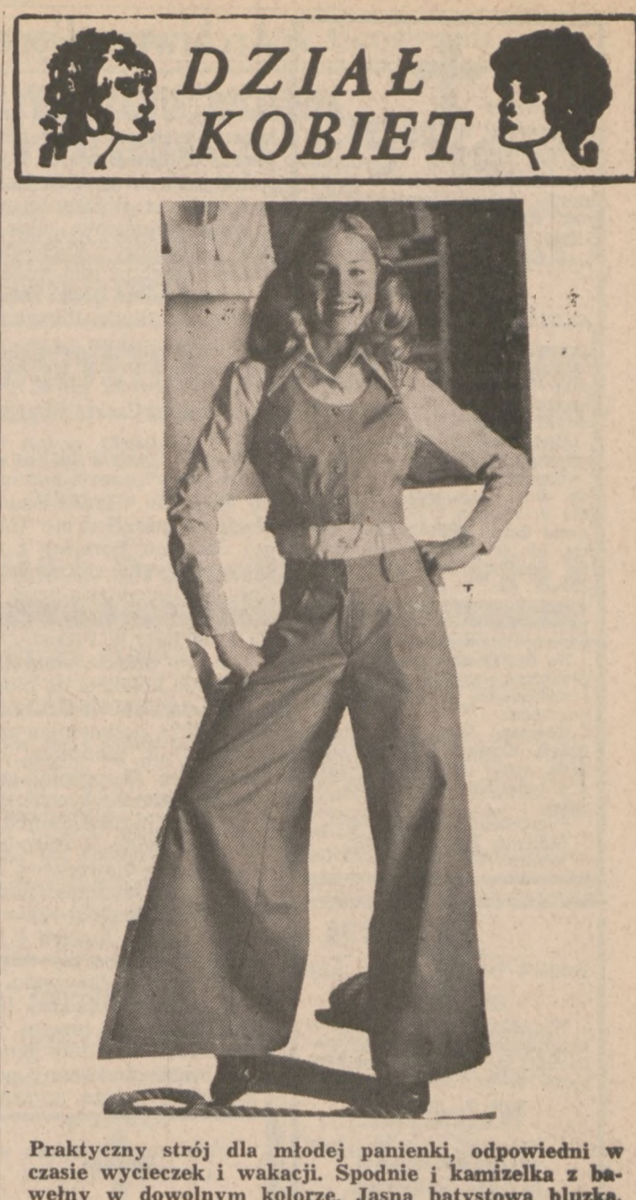
Praktyczny strój dla młodej panienki, odpowiedni w czasie wycieczek i wakacji. Spodnie i kamizelka z bawełny w dowolnym kolorze. Jasna batystowa bluzka.