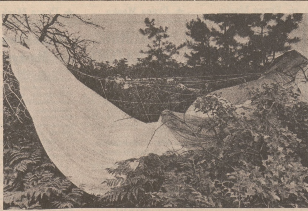
LAKEHURST, N. J. — Dzięki spadochronowi widocznemu na zdjęciu, jeden z członków słynnej eskadry "Błękitnych Aniołów", należącej do składu lotnictwa Marynarki Wojennej U.S. Navy — uratował się i w stanie ciężkim został przewieziony do szpitala wojskowego. Pozostali dwaj członkowie załóg myśliwców F4J Phantom, należących również do tej eskadry, w wyniku kraksy w powietrzu — zginęli. Wypadek miał miejsce niedaleko bazy w Lakehurst.

Zaginiony jest Murzynem, o wzroście 3 stóp 1 cal, wagi 43 funty, posiada bliznę na lewym policzku i ma krótko obcięte włosy.