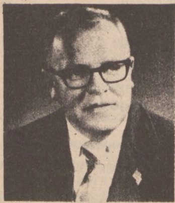
Rep. Edward J. Derwinski

and as it appeared in Roll Call, The Newspaper of Capitol Hill on July 26, 1973