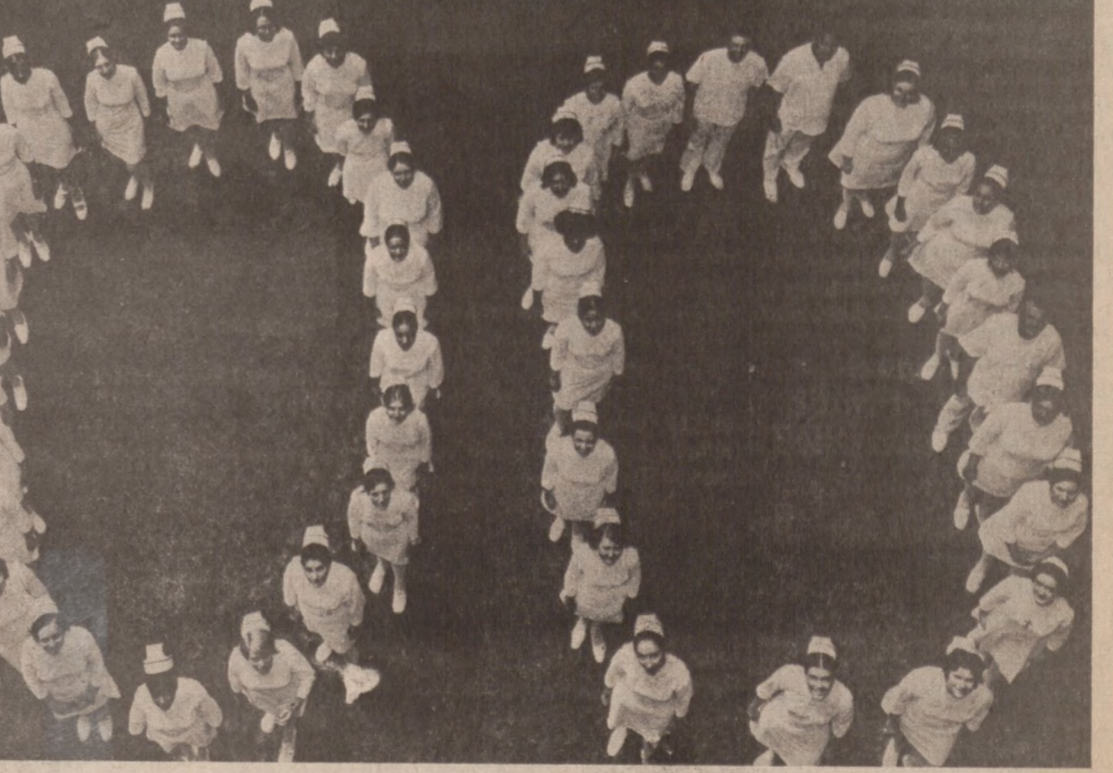
100 LECIE szkół pielęgniarek przy szpitalach. 56 tegorocznych graduantek Szkoły Pielęgniarek przy Szpitalu SS. Nazaretanek ustawiło się tworząc symboliczne "100" dla uczczenia setnej rocznicy istnienia szkół pielęgniarek przy szpitalach. Tegoroczne graduantki szkoły pielęgniarek Szpitala SS. Nazaretanek, wśród których znaczny procent stanowią absolwentki polskiego pochodzenia, otrzymują dyplomy 17 sierpnia, po wysłuchaniu graduacyjnej mszy św. w kościele św. Jana Kantego. W tym dniu otrzymują również dyplomy graduanci Szkoły Radiologii i Techników Medycznych przy Szpitalu SS. Nazaretanek.