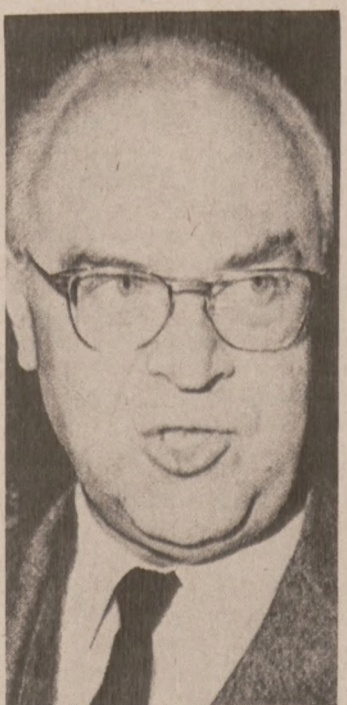
SAN CLEMENTE, CALIF. — Ambasador sowiecki w U.S. Anatol Dobrynin, spotkał się w dniu 1 września br. z amerykańskim, nowomianowanym sekretarzem stanu — Henry Kissingerem.