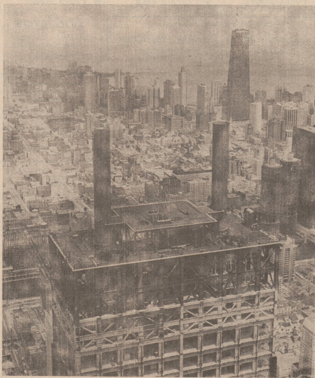
Fragment panoramy miasta Chicago. Na pierwszym planie, największy na świecie budynek, liczący 1454 stóp, słynny Sears Tower. Już wkrótce zostaną na nim zainstalowane nadawcze anteny telewizyjne kanałów 7 i 11.