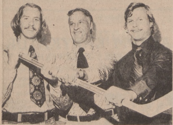
NEW YORK: Gordie Howe (C), former hockey star with the Detroit Red Wings and the greatest goal-scorer and point-amasser in the history of the National Hockey League, joins with his two sons, Marty (L) and Mark, during an interview here 9/6. Howe, 45, will end a two-year retirement by playing for the Houston Astros of the World Hockey Association. Marty, 19, and Mark, 18, will be his teammates on the Aeros.