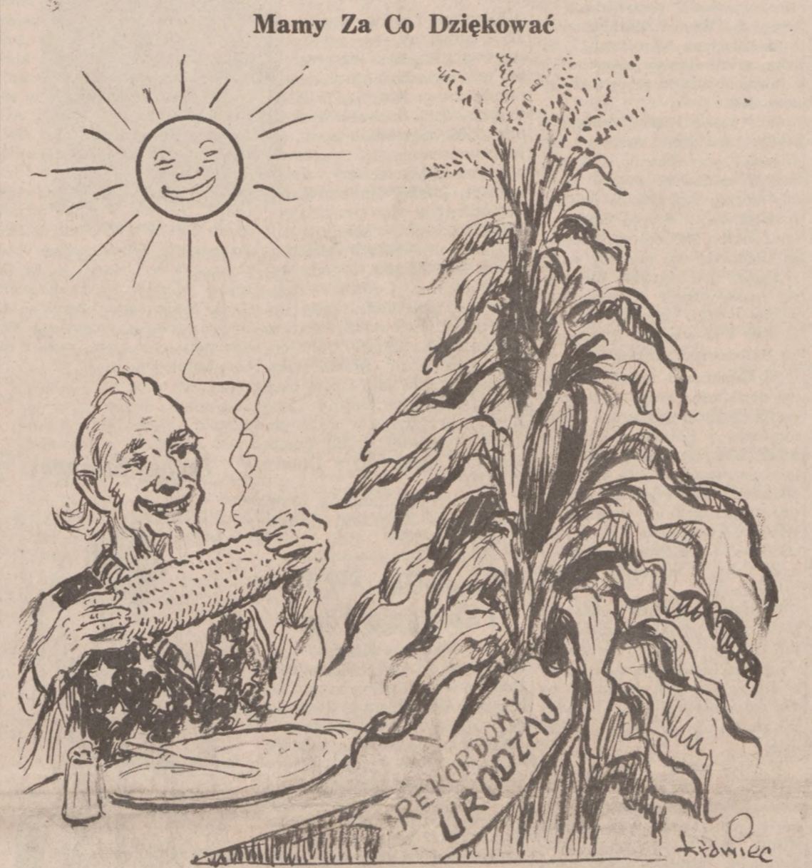
Mamy Za Co Dziękować

Trasę tę, mierzącą 3,390 mil, odrzutowiec "Concorde" pokonał w 3 godziny i 33 minuty.