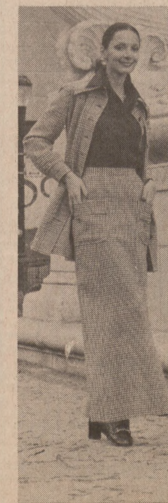
Modny kostium jesienny z wełny w kolorze popielatym. Długa spódnica żakiet zapinany na guziki. Bluzka czarna lub granatowa z dowolnego materiału.

Obecnie lekarze amerykańscy obliczyli, że co czwarty pacjent umierający na zawał — to kobieta. Zjawisko to wiąże się z faktem, że coraz więcej kobiet pali i to pali dużo. Co gorsze, — nikotyna szkodzi sercu kobiety bardziej niż mężczyzny. Namiętnie palaczki ulegają bowiem zawałowi trzy razy częściej niż tyle samo palący mężczyźni.