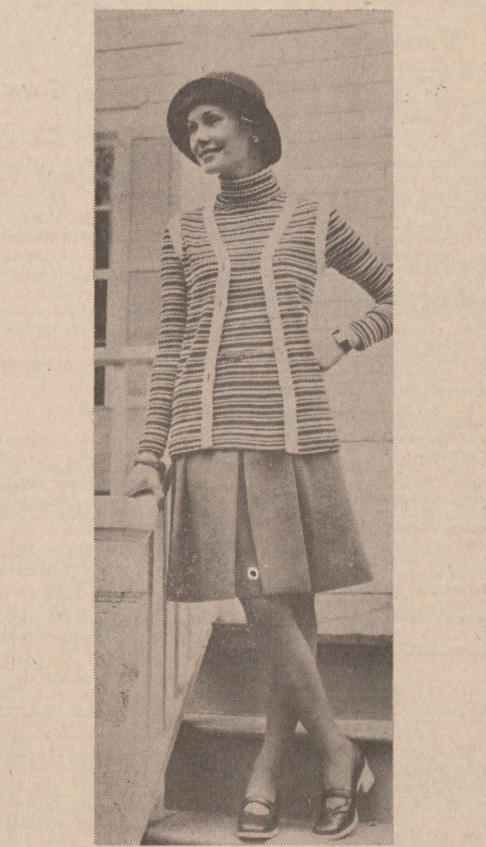
SWETER i kamizelka stanowią nieodzowną całość w stroju jesiennym. Na zdjęciu sweter z orlonu, biało-granatowy, z długimi rękawami. Kamizelka z tego samego materiału. Granatowa spódnica.