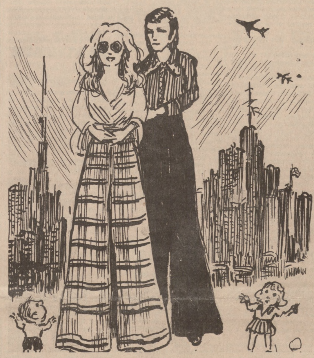
Moda: Z Jednej Krańcówosci w Drugą

Belgijskie ministrowie o spraw zagranicznych w Brukseli, potwierdziło dzisiaj wiadomość o uwolnieniu porwanego ambasadora belgijskiego w Hawanie.