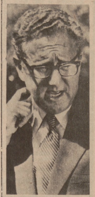
OSLO. — Henry Kissinger, Sekretarz Stanu U.S.A., został laureatem pokojowej nagrody Nobla na rok 1973. Wraz z nim nagrodę otrzymał, specjalny doradca Hanoi, Le Duc Tho.

Straty w czołgach obliczane są następująco: Izrael 600 zniszczonych na ogólną liczbę 1,700, Syria—800 na ogólną liczbę 1,400, i Egipt—200 na ogólną liczbę 2,000.