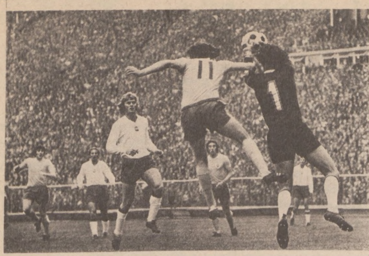
Polish soccer team in action against the English on Wembley Stadium in London Oct. 17. Poles in lighter uniforms. The match ended in a tie, 1:1. However because of earlier victory 2:0 Polish team advanced to the finals of World Championship '74.