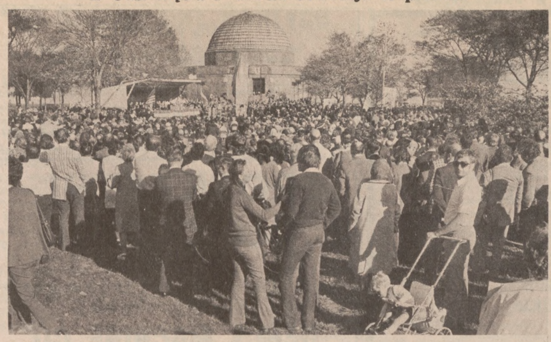
N zdjęciu: — Tłumy przybyłe na uroczystość odświeżenia pomnika Kopernika przed Adler Planetarium w dniu 14 października.