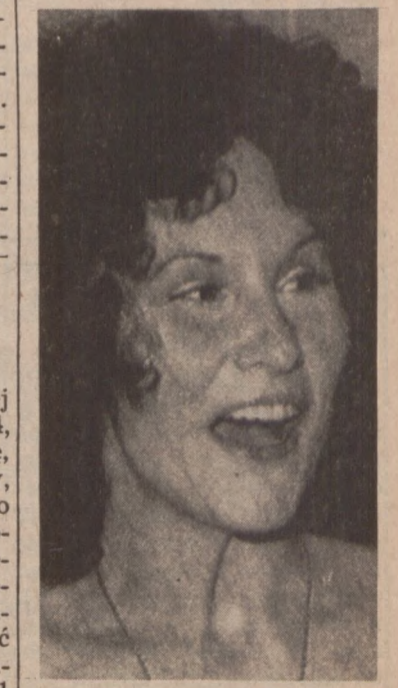
COVINGTON, KY. — Linda Lovelace, kreująca główną rolę w porno-filmie "Deep Throat", została oskarżona o obrazę moralności i sianie zgorznięcia, po stawieniu się na wezwanie w sądzie dystryktowym.