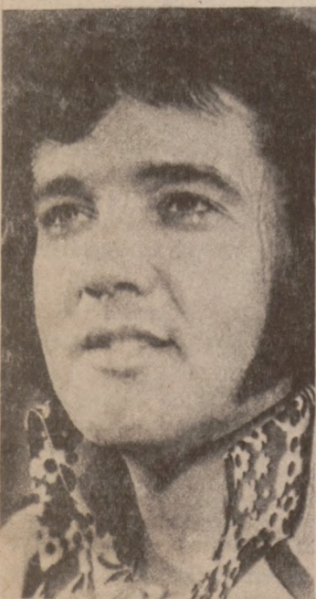
MEMPHIS, TENN. — Elvis Presley, niegdys gwiazdor rock-and-roll, znajduje się w szpitalu. Lekarze podejrzewają zapalenie płuc.

Samolot kosztuje $24.6 miliona. Jeszcze 10 pełni służbę, reszta w liczbie kilkudziesięciu jest wycofywana do rezerwy. Z czasem ich miejsce zajmą satelity bez załóg, wyposażone w komputery i kierowane na odległość.