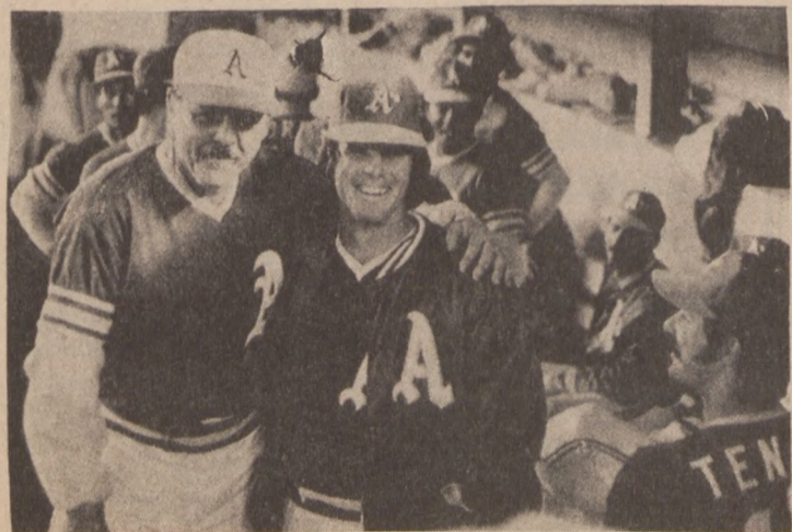
Oakland A's manager Dick Williams (L) puts his arm around second baseman Mike Andrews in dugout before World Series game with N.Y. Mets. Sunday the A's defeated Mets in the decisive seventh game to cling championship of the world. Dick Williams resigned however as manager of the club.