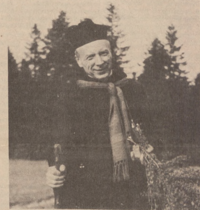
Na przechadzce w Komańcu.