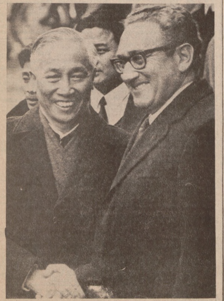
OSLO. — Laureaci Tegorocznej nagrody pokojowej Nobla, Henry Kissinger i Le Duc Tho. Zdjęcie wykonano podczas zakończenia negocjacji uwienczonych pełnym powodzeniem, które w efekcie przyniosło pokój w Wietnamie.

Nauka będzie trwała, dwa dni, 12 i 16 listopada od 9-jej do 11:30 rano i od 1-jej do 3-jej po południu. Kwalifikują się osoby które ukończyły 55 lat i są członkami Amerykańskiego Stow. Emerytów (American Assn. of Retired Persons).