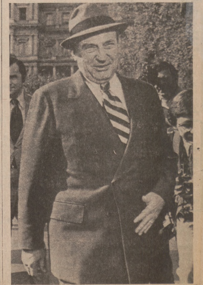
WASHINGTON. — Senator William Saxbe, kolejny kandydat na stanowisko Prokuratora Generalnego U.S.

Ministerstwo przemysłu i handlu zagranicznego nie ukrywa, że jakiegokolwiek ograniczenia w zużyciu prądu elektrycznego oraz racjonowanie paliw płynnych spowodują obniżenie japońskiej produkcji przemysłowej, a tym samym zagrożą zachwianiem japońskiemu bilansowi płatniczemu.