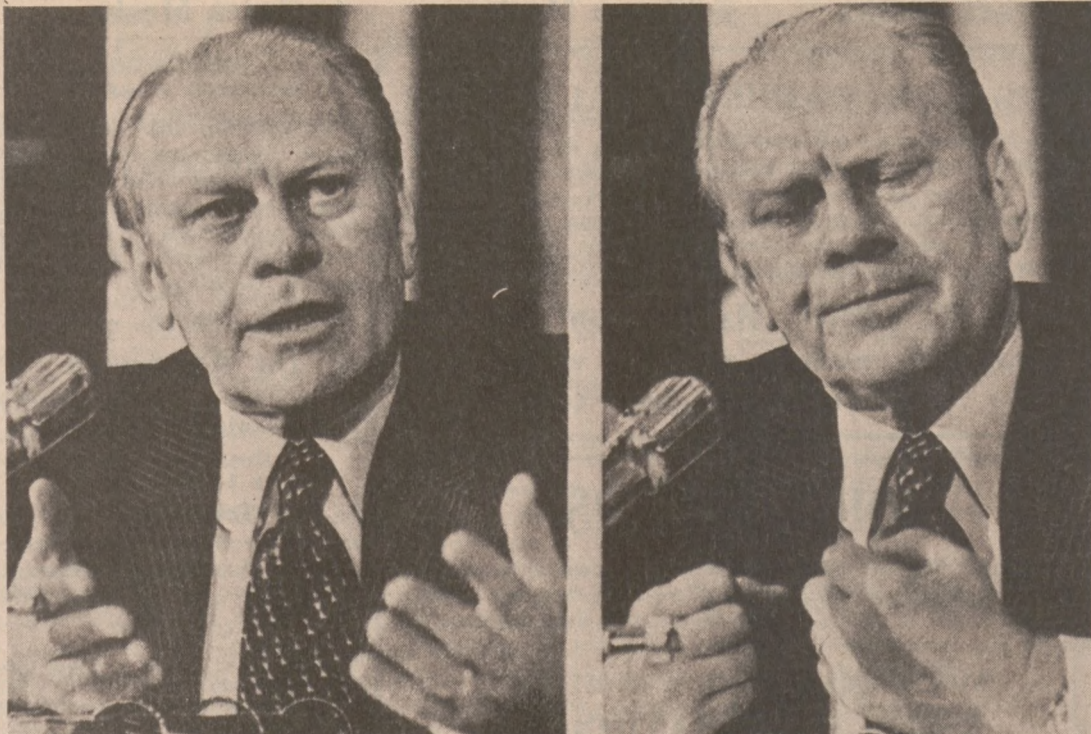
WASHINGTON. — Kandydat na wiceprezydenta, Gerald R. Ford, został poddany szczegółowym badaniom, a jego przeszłość dokładnie przefiltrowana, przez specjalny komitet senacki, który ma zaopiniować, czy kandydatura Forda, może być zatwierdzona przez Senat.