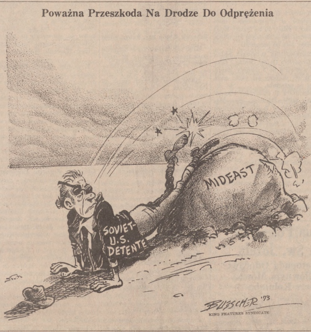
Poważna Przeszkoda Na Drodze Do Odprężenia

Doradca Prawny Białego Domu, Samuel Powers, poinformował sędziego Sirica że odpis rozmów z taśm magnetofonowych, zarządzanych przez sędziego znajduje się w przygotowaniu.