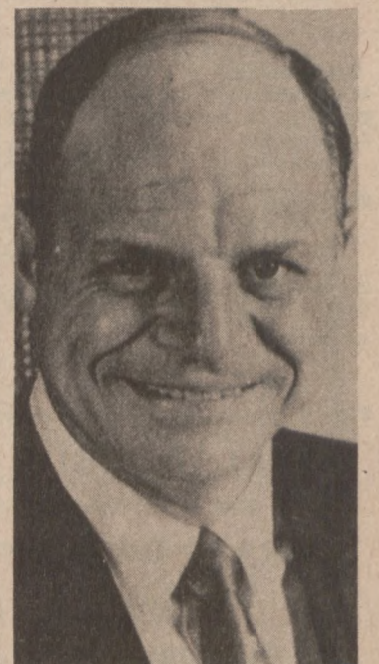
CHICAGO — Znany aktor komediowy, Don Rickles, został okradziony z gotówki i kosztowności na kwotę 38,000 dolarów — podczas weekendowego pobytu w hotelu Ambassador. Wraz z nim ofiarami kradzieży padło również 6 innych osób.