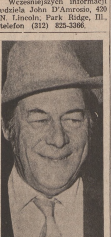
BOSTON — Aktor filmowy, Rex Harrison, otrzymał tytuł doktora honoris causa humanistyki, na Uniwersytecie Bostońskim.