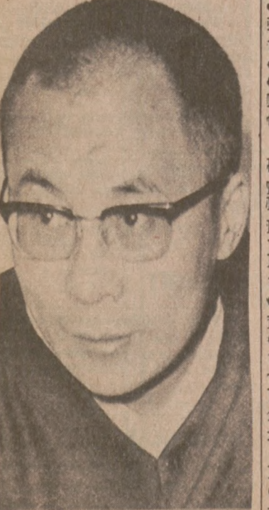
NEW DELHI — Dalaj Lama, duchowy przywódca Tybetańczyków, zakończył swoją 6-tygodniową podróż po krajach Europy Zachodniej.