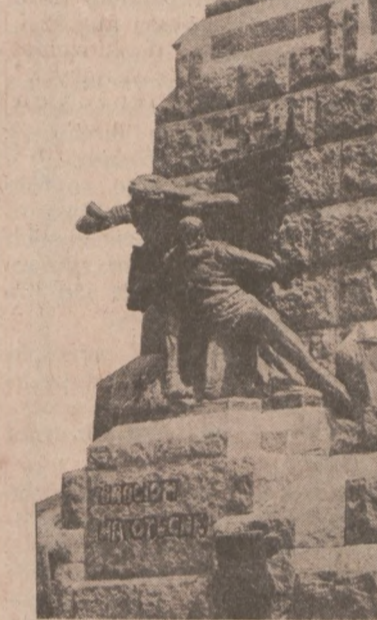
POMNIK GRUNWALDZKI, ofiarowany przez Paderewskiego w 500 rocznicę zwycięstwa pod Grunwaldem.

— Drobne przedmioty chowali Niemcy do wielkiego kufra — wspomina Piotr Borek. — Kiedyś doroczy skupili się w jednym rogu placu, wtedy szpilką otworzyłem kufra. Na samym wierzchu leżała buława. Rzuciłem ją w śnieg i przysypałem. Potem zaniosłem pod kapotą do mieszka-