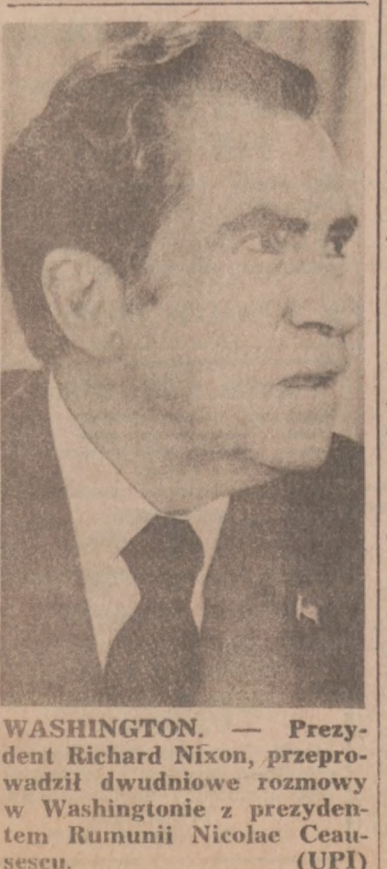
WASHINGTON. — Prezydent Richard Nixon, przeprowadził dwudniowe rozmowy w Washingtonie z prezydentem Rumunii Nicolae Ceausescu.