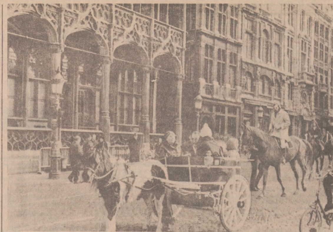
BRUKSELA. — W wyniku kryzysu energetycznego, który najbardziej dotknął kraje Europy zachodniej, na ulicach wielkich miast tej części Starego Kontynentu, coraz częściej można zaobserwować tego rodzaju widoki.