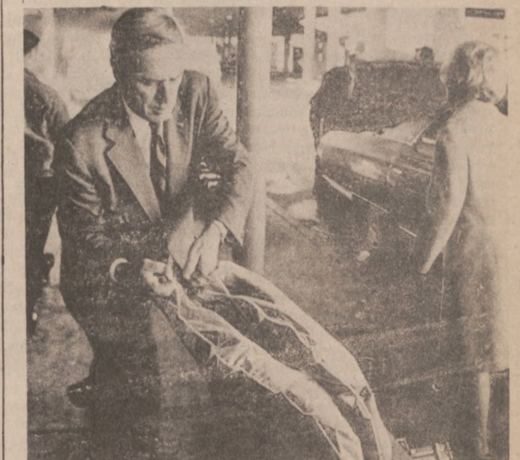
DENVER. — John A. Love, po złożeniu rezygnacji ze stanowiska szefa doradców prezydenta dla spraw energetycznych, opuścił Washington. Na zdjęciu Love wyładował samolot, po przybyciu do rodzinnego Denver w Colorado.

Belfast. — Bojówka protestanckich terrorystów, która precyzywna jest utworzeniu Rady Irlandzkiej z udziałem katolików, zapowiedziała że z Nowym Rokiem zacznie odnowa zabijając katolików i "wszystkich tych, którzy są wrogo nastawieni wobec sprawy protestantów".