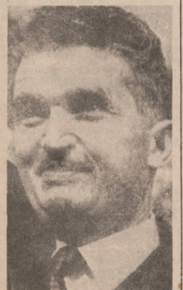
HARTFORD CONN. — Prezydent Rumunii — Nicolae Ceausescu, po swojej oficjalnej wizycie w Washington, odwiedził jeszcze kilka miast amerykańskich.