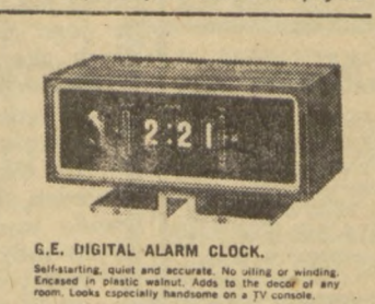
G.E. DIGITAL ALARM CLOCK. Self-setting, quiet and accurate. No using or winding. Increased in plastic without. Adds to the sound of any room. Looks especially handsome on a TV console.