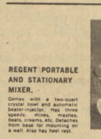
REGENT PORTABLE AND STATIONARY MIXER. Comes with a two-quart crystal bowl and automatic beater-mixer. Has three speeds: stir, beat, whip. Beats Creams, etc. Detaches from base for mounting on a wall. Also has heat rest.

One of the four gifts below is yours free when you deposit $5,000 or more, or when you deposit $1,000 and pay $5.