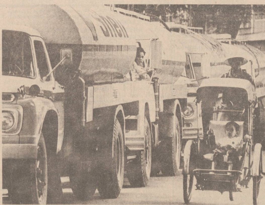
WASHINGTON — Wydarzeniem Nr. 4 roku 1973 stał się kryzys energetyczny i embargo arabskie na ropę naftową. (UPI)

Haga (UPI). Holenderski niszczyciel zderzył się z brytyjskim tankowcem u ujścia rzeki Scheldt. Przyczyną kolizji była gęsta mgła. Jeden członek załogi niszczyciela "Noord-Barbant" zginął oraz jeden doznał obrażeń. Zniszczenia tankowca "Tacoma City" nie były znaczne. Nikt też z załogi nie został ranny.