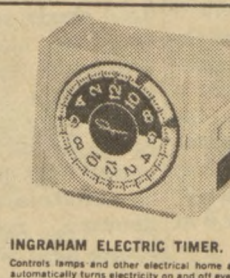
INGRAHAM ELECTRIC TIMER. Controls lamps and other electrical home appliances—automatically turns electricity on and off every 24 hours. A safety shutoff when you go on vacation or leave your home on other occasions.