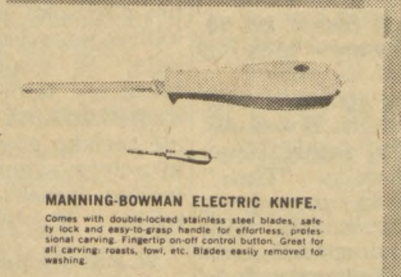
MANNING-BOWMAN ELECTRIC KNIFE. Comes with double-locked stainless steel blades, safe to lock and easy-to-grasp handle for effortless, precise, slicing, carving. Fingerprint control button. Great for all carving, roasts, turk, etc. Blades easily removed for washing.