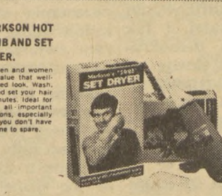
MARKSON HOT COMB AND SET DRIER. For men and women who desire that well-groomed look. Wash, dry and set your hair in minutes. Used for those all-important occasions, especially when you don't have the time to spare.