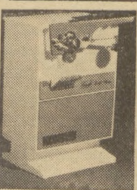
GRANTS ELECTRIC CAN AND BOTTLE OPENER. Comes with magnetic lid lifter, removable handle and cutting assembly for easy cleaning. Every kitchen should have one in white only.

One of the four gifts below is yours free when you deposit $1,000 or more, or when you deposit $100 and pay $5.