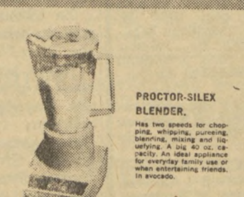
PROCTOR-SILEX BLENDER. Has two speeds for chopping, mixing, pureeing, blending, mixing and softening. A 100 cc. capacity. An ideal appliance for everyday family use or when entertaining friends in excess.

Gift offer good while the supply lasts • Limited to one gift per household • Sorry, no delivery of gifts by mail