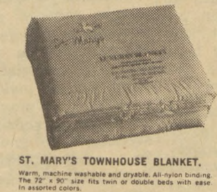
ST. MARY'S TOWNHOUSE BLANKET. Warm, machine washable and dries in 45 minutes. The 72" x 90" size fits twin or double beds with ease in covered corners.