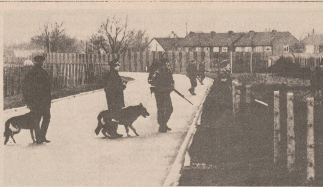
LONDYN. — Oddziały policji brytyjskiej przy pomocy specjalnie przeszkolonych psów przetrząsają tereny wokół londyńskiego lotniska w poszukiwaniu rzekomo podłożonych tam ładunków wybuchowych.