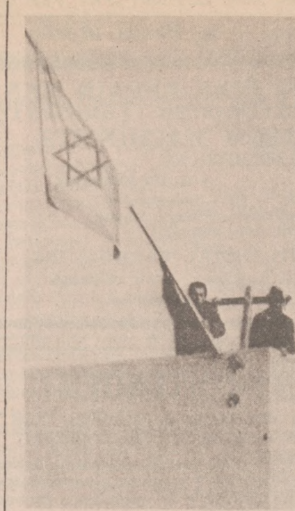
ADABIYA, EGIPCI. — Salwa honorowa, ceremonia opuszczenia flagi narodowej, ostatni raport. W taki sposób wojska Izraela zakończyły 96-dniowy okres okupacji terytorii Egiptu, położonych po zachodniej stronie Kanału Sueskiego.

cji nowego inspektora chicagowskiej policji w miejsce Jamesa B. Conliska Jr., który ustąpił z tego stanowiska — wskutek presji opinii publicznej — i przypuszczalnie mayora Daley — po głośnym skandalu wymuszania przez policjantów pieniędzy od właścicieli barów i lokali nocnych. Mayor Daley odmówił komentarzy na temat swego ostatecznego wyboru z listy kandydatów, którą ma mu przedstawić Rada Policji. Mayor oznajmił, iż jak dotychczas nie otrzymał takowej listy w związku z czym jego decyzja zapadnie dopiero w — przyszłym tygodniu a nie pod koniec bieżącego, jak to wcześniej zapowiadał. Zgodnie z prawem stanowym mayor Chicago może odrzucić wszystkich trzech przedstawionych mu kandydatów, i zażądać ponownej selekcji przez Radę Policji. Niekiedy sugerują, iż Daley właśnie to uczyni, gdyżby na liście nie znalazło się nazwisko Jamesa Rochforda, tymczasowego inspektora, uważanego za faworyta w ubieganiu się o stanowisko.