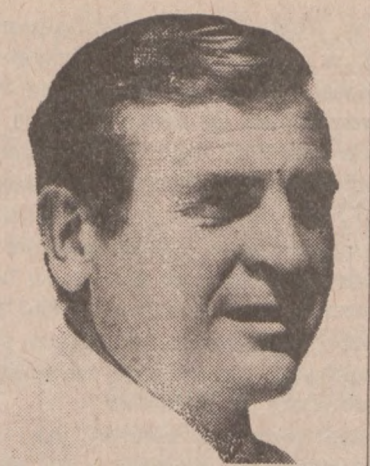
Kongr. Daniel Rostenkowski

Dorocznym zwyczajem 32 Warda Organizacji Demokratycznej urządza bankiet połączony z zabawą taneczną, aby zebrać fundusze niezbędne na prowadzenie szeregu programów: młodzieżowych społecznych i kościelnych. Komitymanem 32-iej wardy jest kongresman Dan Rostenkowski. W tym roku bankiet odbędzie się w piątek, 19-go kwietnia o 6:30 po południu w Chateau Royale, 5729 - 47 W. Chicago ul. Bilety w cenie $20,00.