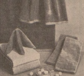
8-PIECE TOWEL SET All-cotton famous Cannon Monticello "Softie" towels. Set contains 2 bath towels, 2 face towels and 4 washcloths. Sparkling colors in rich Velvure enhanced by patterned hems. Comes in pink, green, cinnamon, orange, yellow and plum.