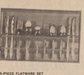
25-PIECE FLATWARE SET The famous Rogers International superior stainless steel flatware set includes: 4 forks, 4 knives, 4 soup spoons, 4 salad forks, 8 teaspoons and 1 serving spoon. Your choice of the Petal Lane or the Radiant Rose pattern.