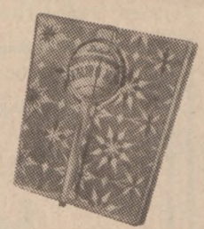
BATHROOM SCALE A handsome, accurate stand-up scale with a sparkling, embossed white-on-white vinyl mat. Giant 3 1/2" is makes figures easy to read. Convenient carrying handle. For weights up to 280 lbs.