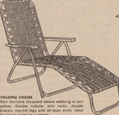
FOLDING CHAIR Rich two-tone Jacquard weave webbing in sun yellow. Double tubular arm rests, double braces, non-tit legs and all-spun ends. Ideal for those warm days ahead.