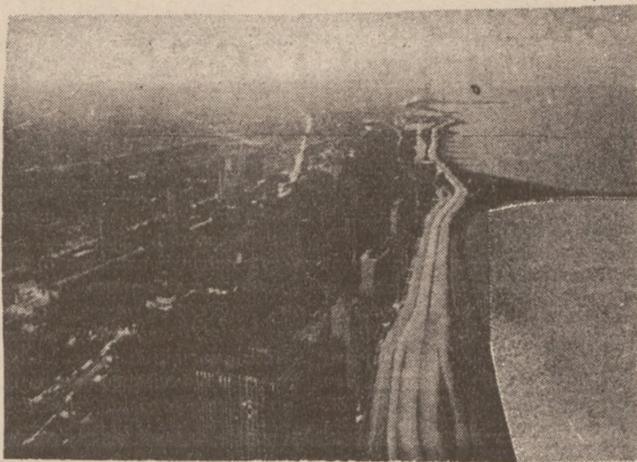
Chicago. — Olbrzymie piękne miasto rozsiadłe nad jeziorem Michigan, którego krańce gubią się we mgłę.

Poza obwodem "A", który posiada dwie dyrektorki i dwóch dyrektorów — na każdy dalszy Obwód przypada jeden dyrektor lub dyrektorka.