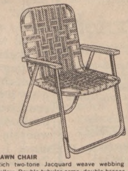
LAWN CHAIR Rich two-tone Jacquard weave webbing in sun yellow. Double tubular arms, double braces, non-tit legs and all-spun ends. A must for every patio.