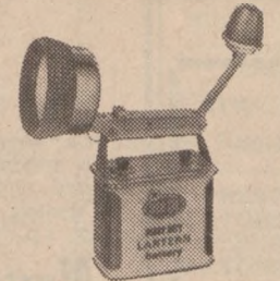
DUAL LANTERN Long-range brilliant lantern beam and a powerful red flasher combined. Separate control switches, adjustable lantern head. Rugged chrome-plated steel construction. Weather-proof heavy-duty battery included.