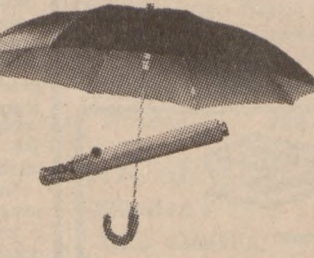
FOLDING UMBRELLA "Super one-touch" self-opening 100% per cent nylon umbrella. Comes with a chrome-rod case and matching handle. Your choice of the men's or ladies' model.