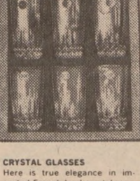
CRYSTAL GLASSES Here is true elegance in imported French lead crystalware. The delicate styling of the Versailles pattern will graciously enhance any table setting. Your choice of tall or short glasses.