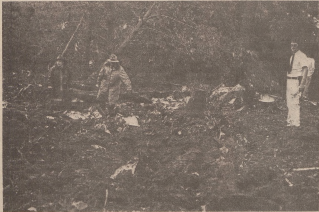
SPRINGFIELD. — Straż Pożarna i władze cywilne dokładnie przeszukują miejsce katastrofy samolotu, która wydarzyła się 23 maja br. w okolicy Springfield.