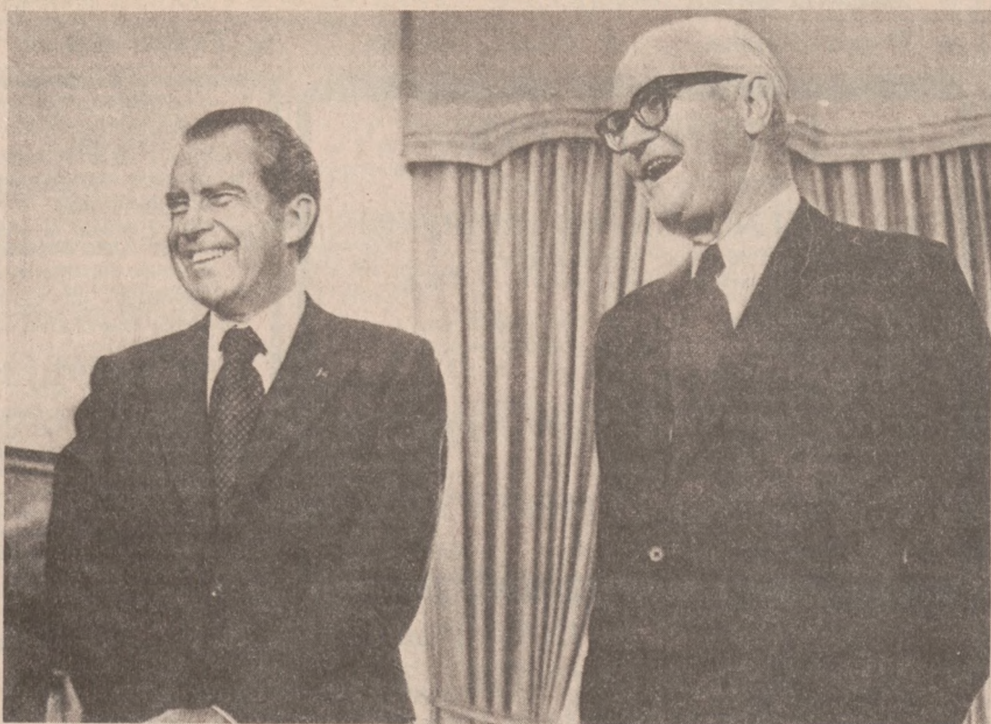
WASHINGTON. — Prezydent Nixon w towarzystwie swego nowego doradcy do spraw polityki ekonomicznej, wybitnego naukowca i profesora prawa, Kennetha Rush. Po Henry Kissingerze jest on drugim przedstawicielem świata nauki w najbliższym otoczeniu Prezydenta.