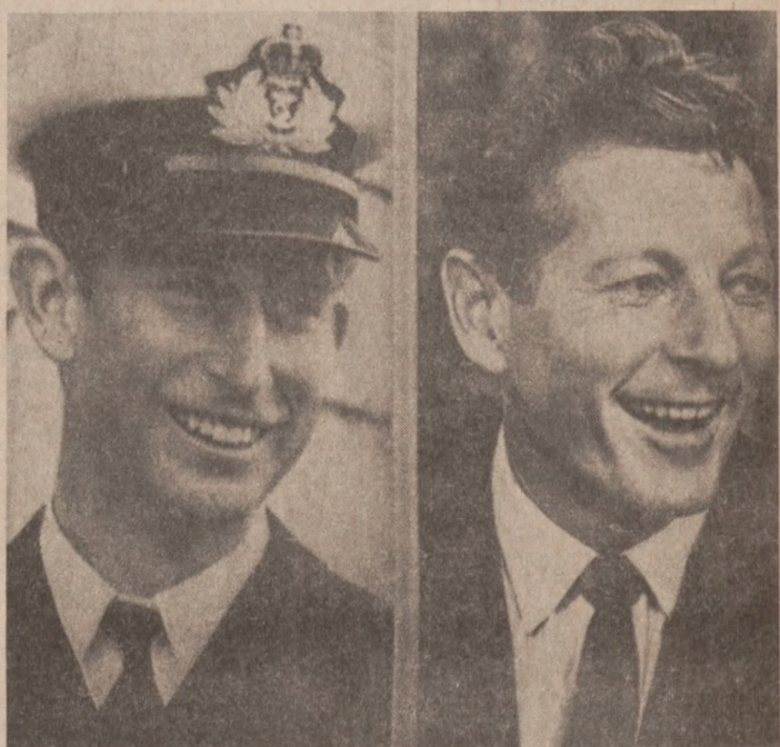
MANCHESTER, W.B. — Znany aktor i komik amerykański, Danny Kaye, spotkał się w Anglii w tzw. Variety Club z następcą tronu brytyjskiego, księciem Karolem, z którym odbył mecz opowiadania kawałów. Zgodnie z werdyktem sędziowskim, na punkty zwyciężył następca tronu, ale Danny Kaye zażądał rewanżu.