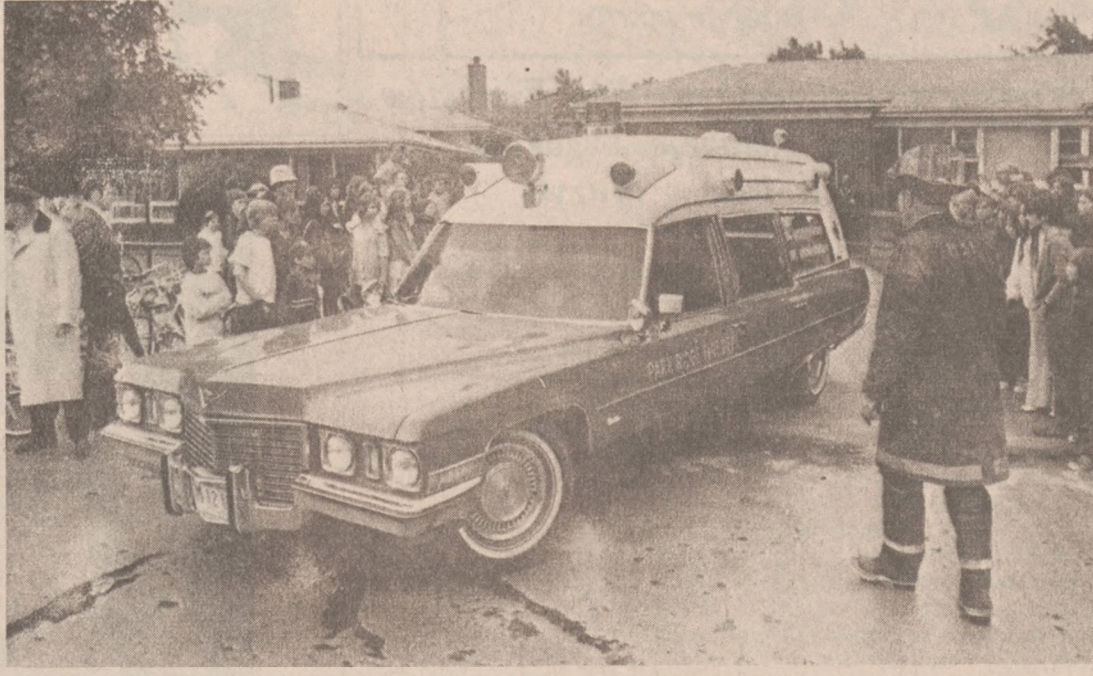
CHICAGO.—Straż pożarna wezwana do ugасzenia pożaru w jednej z posesji dzielnicy Park Ridge...

Wszystkim krewnym i znajomym donosimy że smutną wiadomość, iż najukochańszy mąż, ojciec, brat, szwagier i dziadus nasz, s.p.