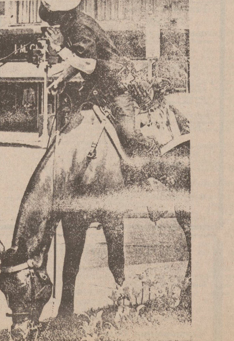
DETROIT, MICH.—Policjant detroicki tlefontuje na stację policyjną z konia, który sobie tymczasem spokojnie gryzie trawę na ulicy miasta.

Regimentem natomiast, czyli pułkiem w wojskach cudzoziemskiego autoramentu, dowodzi oberster. Pułkiem w wojskach narodowego autoramentu dowodzi pułkownik.