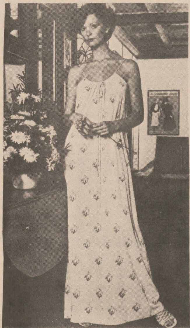
SUKNIA z deseniowego jedwabiu, odpowiednia na zabawy i przyjęcia w sezonie letnim. Model Donalda Brooks.