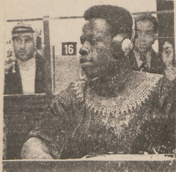
POLSKA. — Student z Afryki uczy się języka polskiego przed przystąpieniem do dalszych studiów na uniwersytecie Łódzkim.