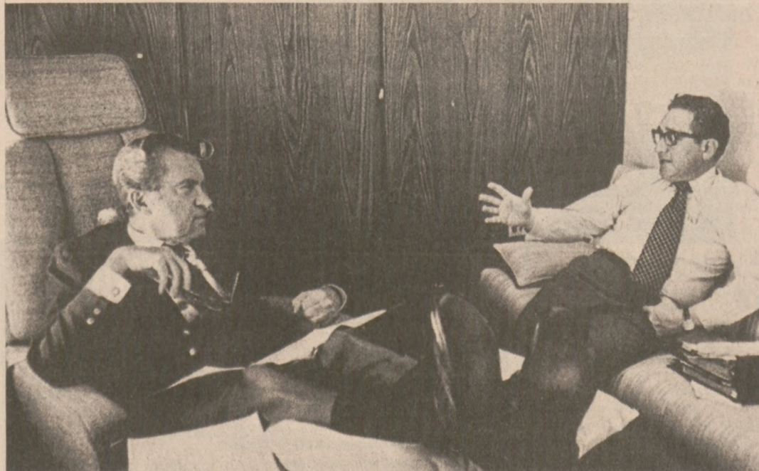
BRUKSELA.—W drodze do Europy na pokładzie specjalnego samolotu pasażerskiego, prezydent Nixon pracowicie spędza czas, omawiając z Sekretarzem Stanu U.S. Henry Kissingerem najważniejsze problemy, które będą poruszone w toku spotkań europejskich.