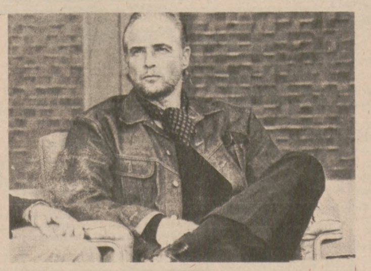
LOS ANGELES.—Znany aktor filmowy, Marlon Brando, poddał się leczeniu groźnej choroby gardła. Jego pobyt w szpitalu potrwał kilka dni — oświadczył rzecznik szpitala UCLA Medical Center.

New York (GP). Arabia Saudyjska zamierza przejąć 60 proc. udziałów "Aramco" (Arabian American Oil Co.), największej firmy naftowej na świecie, która wydobywa 8.5 miliona baryłek ropy naftowej dziennie. W chwili obecnej Arabia Saudyjska ma 25 proc. udziałów w tej firmie. "Aramco" została utworzona w 1933 r. przez Standard Oil Co. Później przystąpiły do niej firmy Texaco, Exxon i Mobil. Zgodnie z dotychczasową umową Arabia Saudyjska przejęła 25 proc. udziałów dwa lata temu, z tym, że do 1983 r. będzie miała w swych rękach 51 procent udziałów.