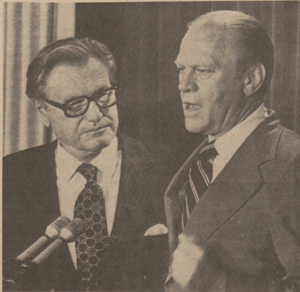
WASHINGTON.—Prezydent U.S. Gerald R. Ford, zaproponował kandydaturę Nelsona Rockefellera, byłego gubernatora New Yorku, na urząd wiceprezydenta U.S.