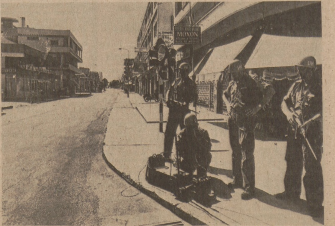
FAMAGUSTA, CYPR.—Patrol piechoty szwedzkiej, wchodzącej w skład kontyngentów wojskowych O.N.Z. na Cyprze, w czasie akcji na ulicach Famagusty.