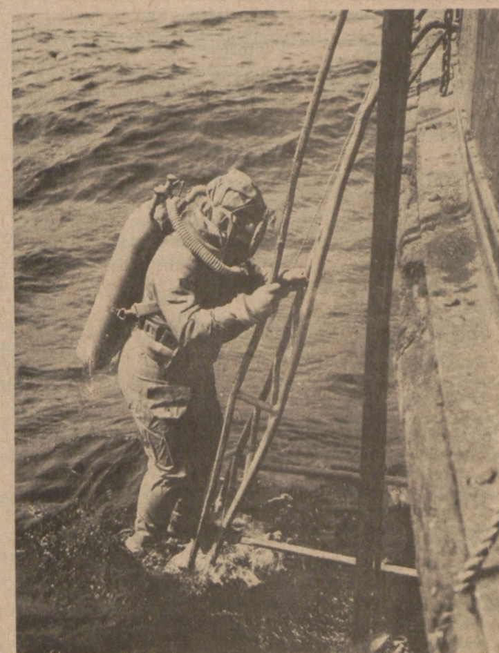
Pletwonurek schodzi z wody.

... gdzie się chłopcy z tamtych lat ... gdzie są ... ?