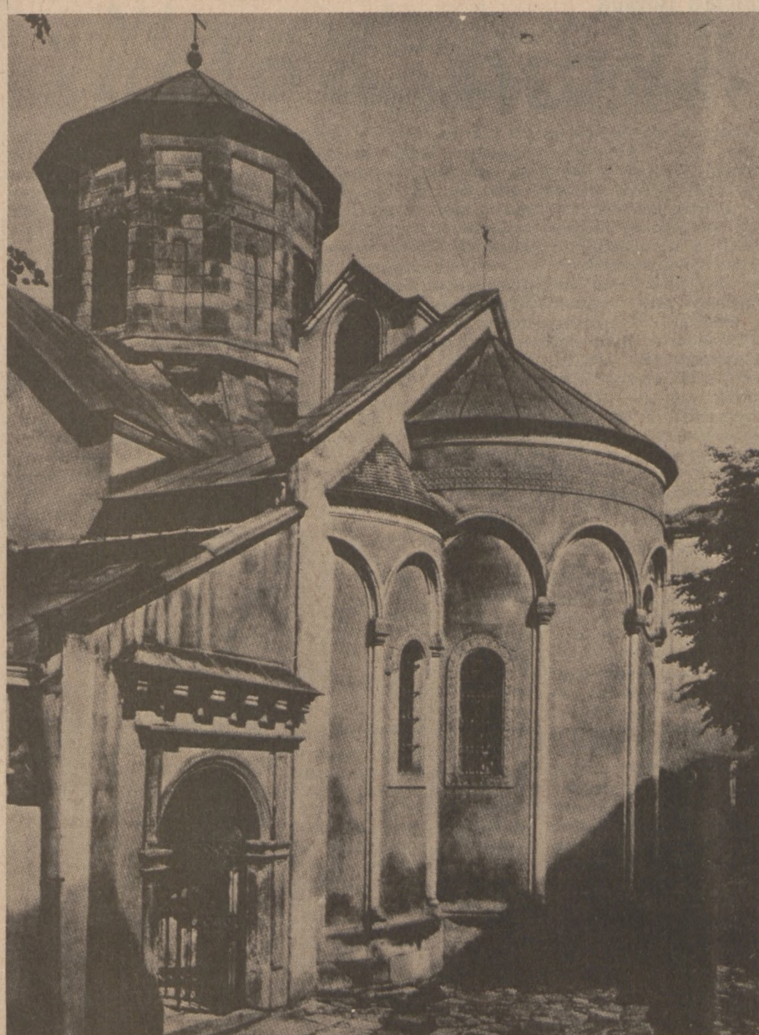
LWÓW — KATEDRA ORMIAŃSKA

Co tu zostanie po mnie? — Słowo. I w głąb wpuszczone me korzenie, Ziemia niech z nich zagada mowa, Z ziemi powstałem, w nią się zmienię.