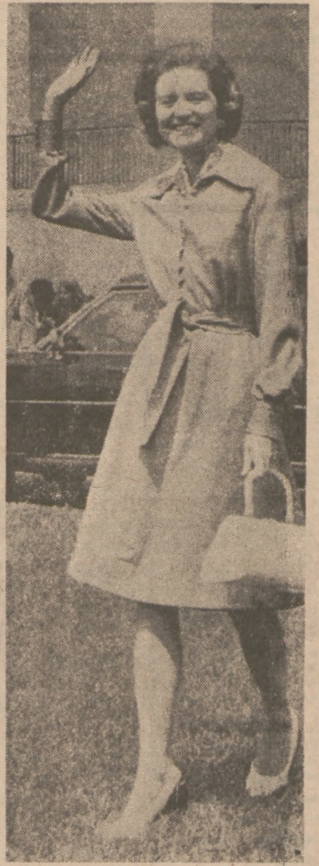
Betty Ford, żona Prezydenta U.S., pozuje do zdjęcia na kilka dni przed przeprowadzką do Białego Domu. Pani Ford znana jest z dobrego gustu i wrodzonej elegancji.