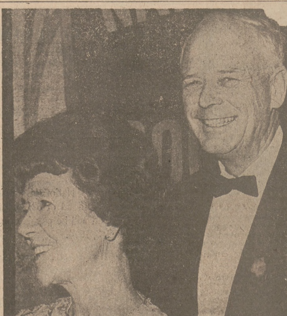
NEW YORK. — Oto jedno z licznych zdjęć Charlesa Lindbergha z żoną, Anne, wykonane w 1969 r. na jednej z uroczystości w Nowym Yorku.

Odpowiedział na problem jest przywrócenie "wewnętrznej siły" obywateli i instytucji, powiedział prok. Saxbe.