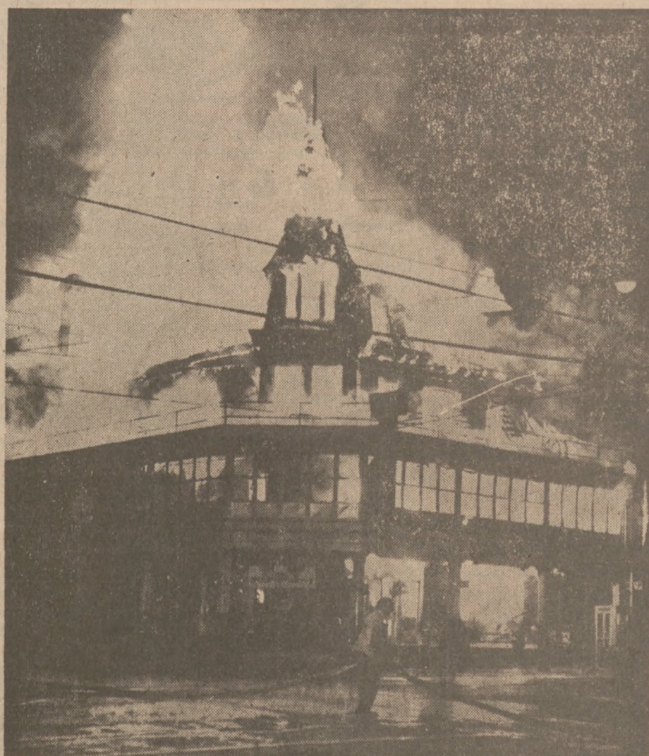
BERKELEY SPRINGS, W. VA. — Straszliwy pożar strawił doszczętnie budynek hotelu Washington House Hotel w Berkeley Springs. W pożarze zginęło siedem osób, a dalszych 12 odniosło rany. Straty szacuje się na około $750 tysięcy. (UPI)

Zona: — Powiedz mi, Arturze, dlaczego zawsze zamykasz okno, gdy zaczynam śpiewać? — Bo nie chce, aby sąsiedzi myśleli, że cię biję. ● Jeżeli chcesz pozbyć się gościa, mów tylko o sobie; jeżeli chcesz go zatrzymać, mów tylko o nim.