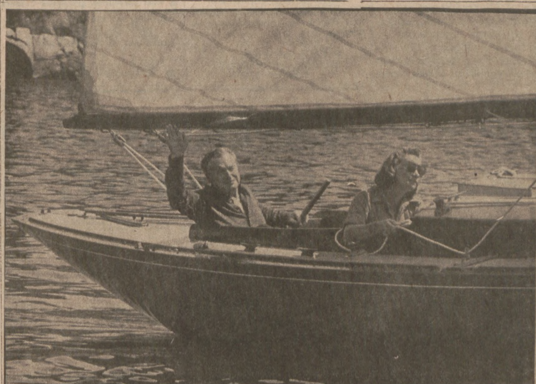
SEAL HARBOR, MAINE. — Desygnowany na stanowisko wice-prezydenta U.S., Nelson A. Rockefeller wraz z żoną, odbywają wycieczkę jachtem żaglowym wzdłuż nadbrzeża portowego w Seal Harbor. (UPI)