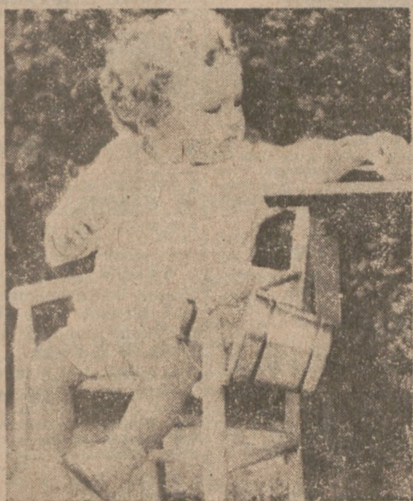
NEW YORK. — W roku 1932, opinia publiczna całego świata wstrząśnięta została do głębi tragiczną wiadomością o bestialskim zamordowaniu uprzednio porwanego dziecka Lindbergha, Charlesa Juniora.

Pociąg zdał z Galesburga do Kansas City.