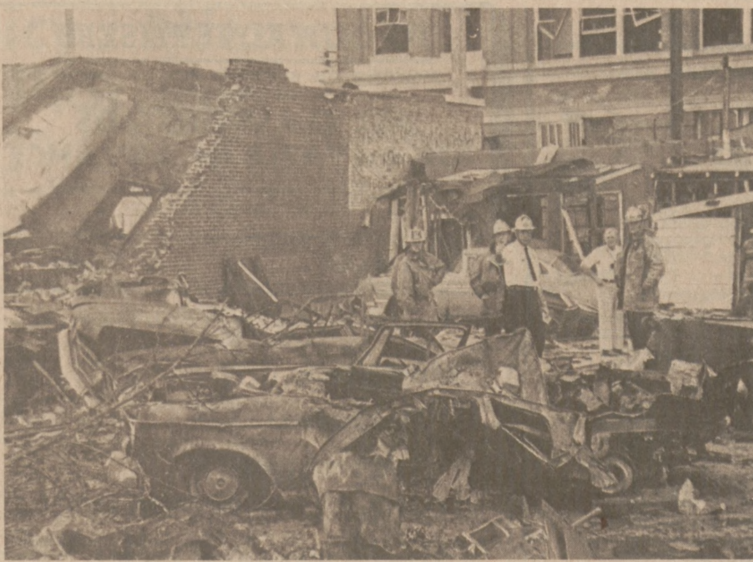
LOS ANGELES.—Groźny pożar składu chemicznego, który wybuchł w samym centrum Los Angeles, spowodował straty około $5 milionów, oraz ciężkie poparzenie 4 osób.