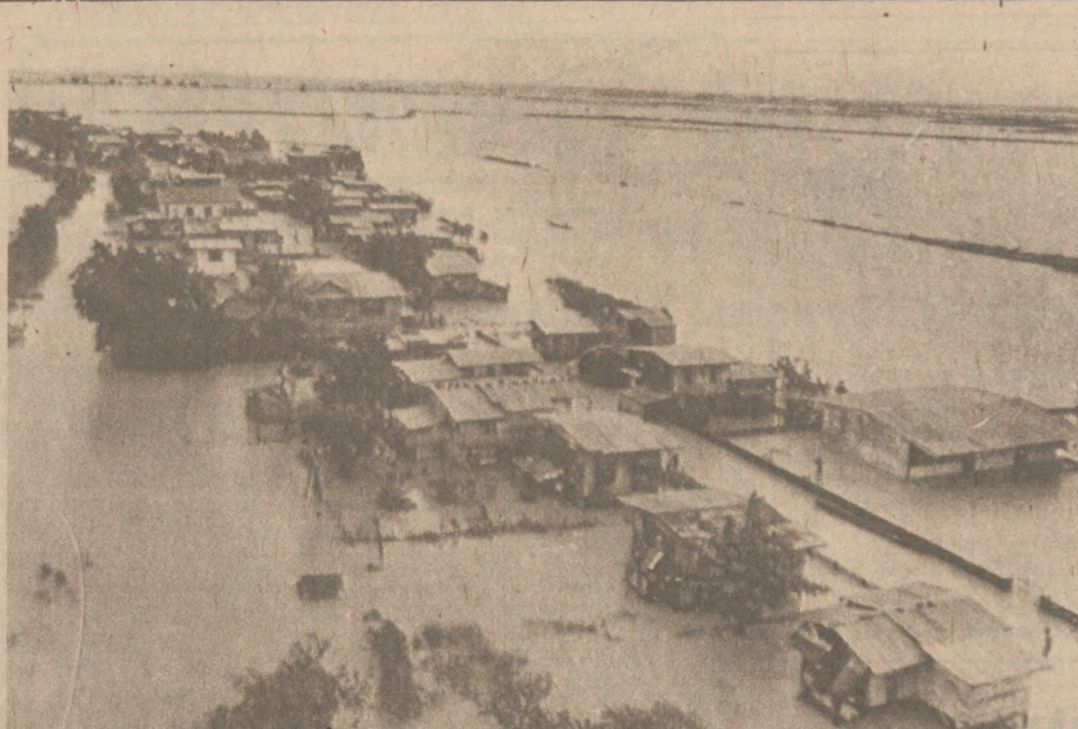
TARLAK, FILIPINY. — Alarm powodziowy w prowincji Tarlak na Filipinach, około 70 mil na północ od Manila — trwa. Powódź spowodował potężny monsun, który nawiedził ten rejon Filipin.