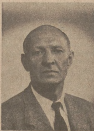
Mgr Alfred Urbański, Premier Rządu RP Na Emigracji

W niedzielę, 1 września będzie o 10:30 rano Msza św. kościoła św. Trójcy poczem dalsze obrady Zjazdu.