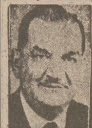
KLEMENS J. ZABŁOCKI KONGRESMAN 4-GO DYSTRYKTU 4245 W. Drury Lane

W Milwaukee odbędzie się ty- lko jeden występ dnia 27-go wrze- śnia, w Vogel Hall, o godzinie 8-iej wieczorem. Szczegóły pro- gramu podamy w odpowiednim czasie, a dziś prosimy tylko od- notować sobie tę datę i umówić się z przyjaciółmi.