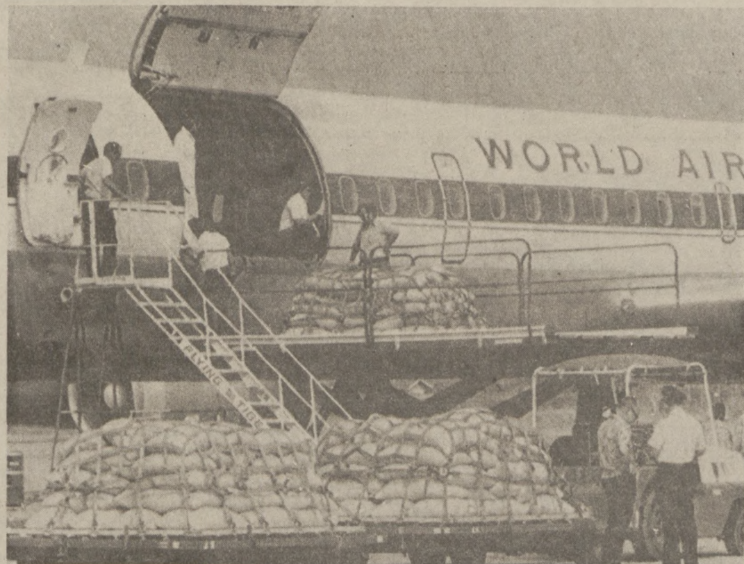
SAJGON. — Worki z ryżem przeznaczone dla obłożonej przez komunistów stolicy Kambodży Phnom Penh — ładowane na jeden z amerykańskich odrzutowców DC-8. 450 takich lotów z żywnością jest planowanych w ciągu następnych 30-tu dni.