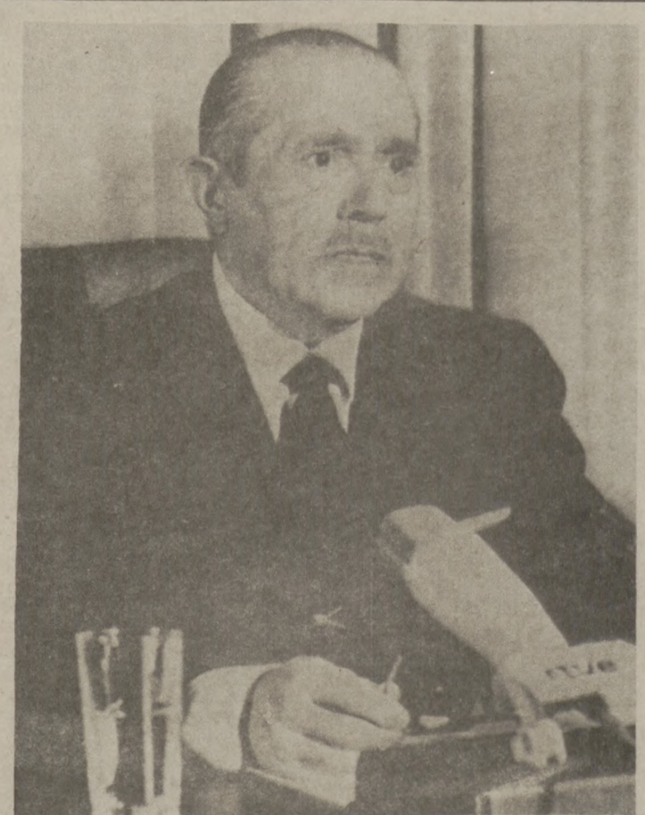
MADRYT. — Premier Carlos Arias oświadczył niedawno korespondentom UPI w ekskluzywnym wywiadzie, iż ma zamiar wprowadzić w Hiszpanii szereg reform politycznych. — Na zdjęciu: Arias w telewizyjnym wystąpieniu do narodu hiszpańskiego.