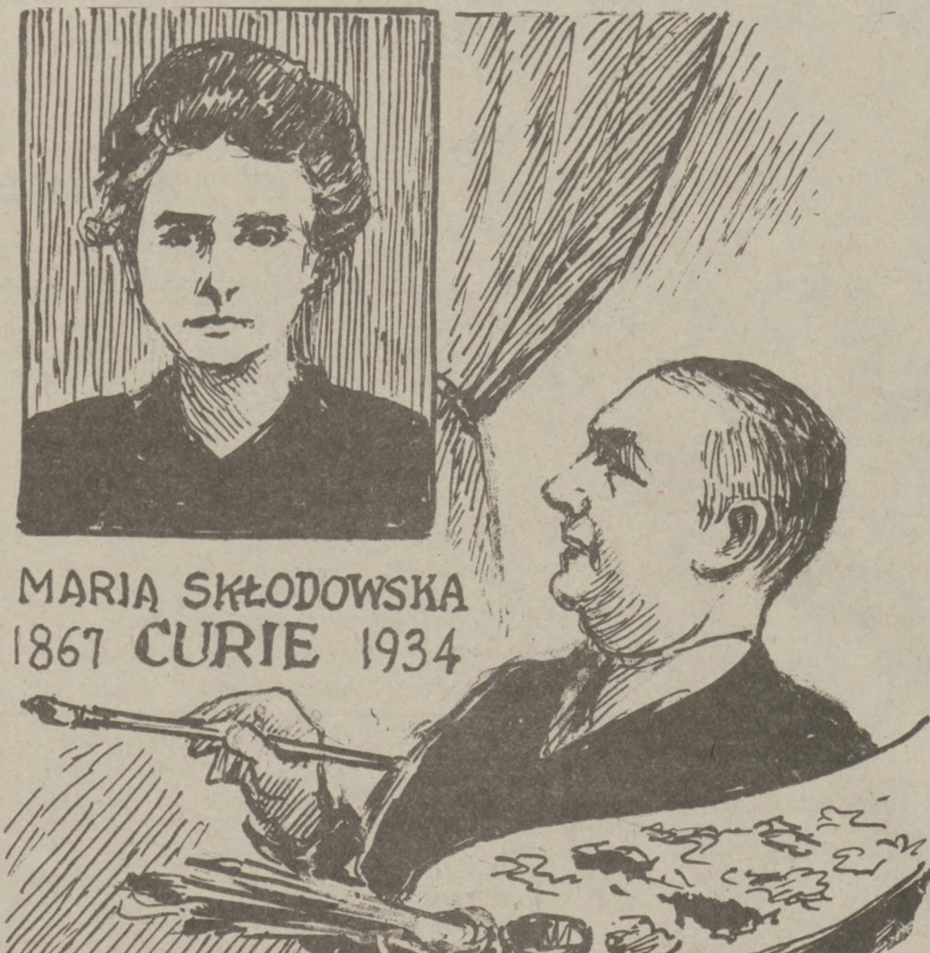
MARIA SKŁODOWSKA 1867 CURIE 1934

Projekt pozwoliłby na zaoszczędzenie około 1,000 domów, jak również zmniejszyćby szkody ulic i autostrad znajdujących się w rejonie o powierzchni 5,600 akrów, które stają się ofiarą dorocznego powodzi. Melas oświadczył, iż projekt znany jako Chicago Metropolitan Area River Basin Plan zmniejszyłby te szkody do około $380,000 rocznie. Interwencja przewodni-