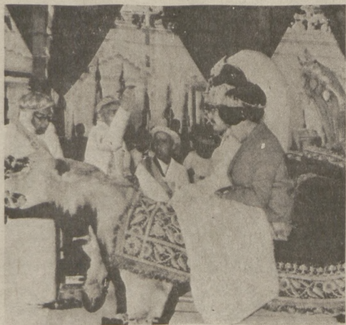
KATMANDU, NEPAL. — Władca Nepalu król Birendra Bir Bikram Shah Dev i jego małżonka, królowa Aishwarya opryskiwani są wodą ze złotej kadzi po zakończonej ceremonii koronacyjnej. Koronacja odbyła się w czasie ściśle wyznaczonym przez nadwornych astrologów.