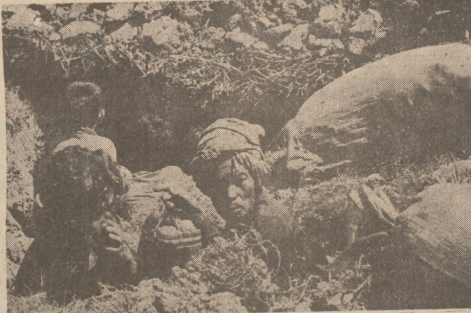
KAMBODŻA. — Uchodźcy chronią się w bunkrze koło Neak Luong, 32 mile na południe od stolicy Phnom Penh, gdzie istnieje ostatni punkt obrony wojsk rządowych Kambodży.