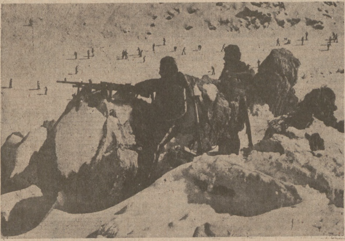
SYRIA. — Żołnierze izraelscy stoją na straży na górze Hermon, w okupowanej Syrii, podczas gdy narciarze cieszą się śniegiem na zboczach. Gdy usłyszano odgłosy

Bielicka debiutowała w wileńskim Teatrze na Pohulance występując m. in. w Świętoszku (Doryna), Wieczorze trzech króli (Marianna). W latach 1945-49 była związana z Teatrem Żołnierza w Łodzi, następnie z warszawskim Teatrem Współczesnym. Od 23 lat pani Hanka jest wierna Syrenie. W dorobku znakomitej aktorki znajdują się także role filmowe ("Zakazane piosenki", "Gangsterzy i filantropi", "Pan Wołodyjowski").