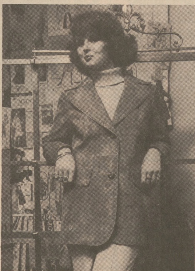
Zamszowa kurtka w kolorze brązowym lub popielatym modna i elegancka.