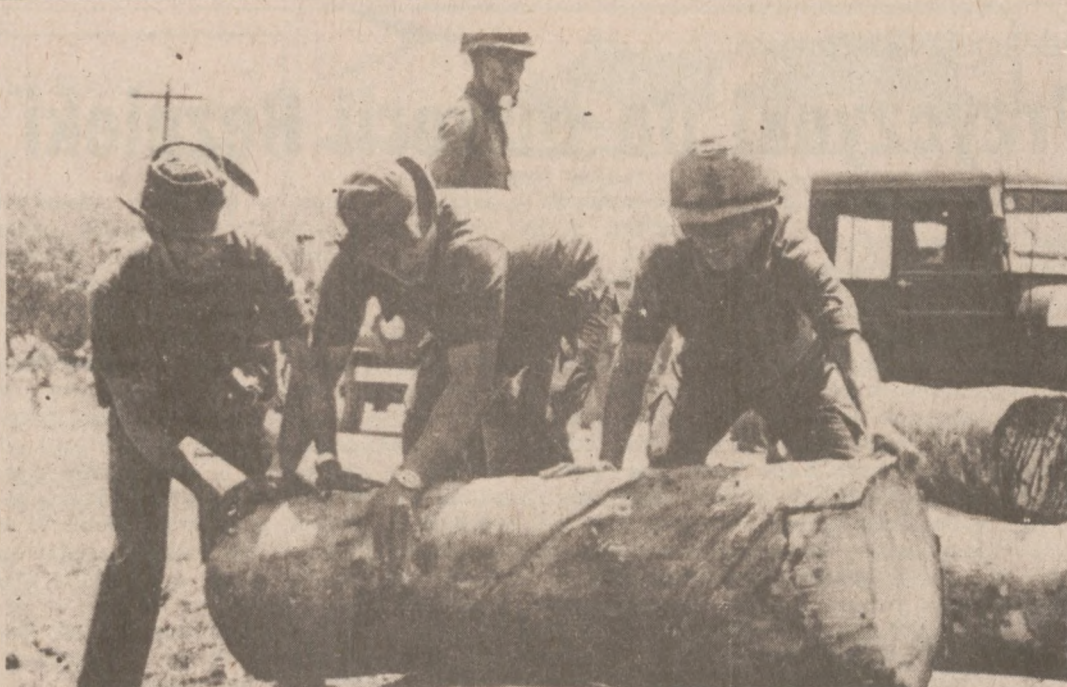
TRANG BOM, PŁD. WIETNAM. — Żołnierze budują umocnienia i ustawiają przeszkody przeciwzołgowe na szosie nr. 1, prowadzącej do Sajgonu. Atak wojsk komunistycznych spodziewany jest lada chwila.

Cieszy się ona wielkim powodzeniem wrocławian. Ekspozycja obejmuje 150 okazów broni białej i palnej, są to wyroby mistrzów platnerstwa i rusznikarstwa z okresu XV-XVIII wieku.