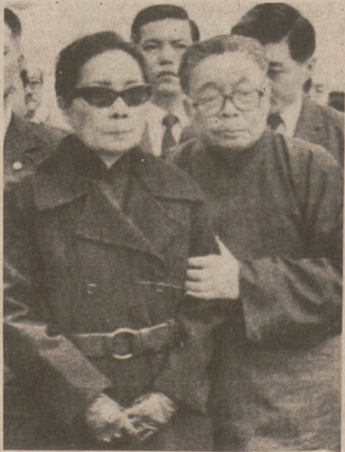
TAIPEI. — Madame Ciang Kai Szek, wdowa po szefie rządu Republiki Chińskiej na terenie Tajwanu, idzie za trumną zmarłego wraz z najstarszym synem dr Sun Yat-sen. Państwowy pogrzeb odbędzie się 16 kwietnia 1975 r.