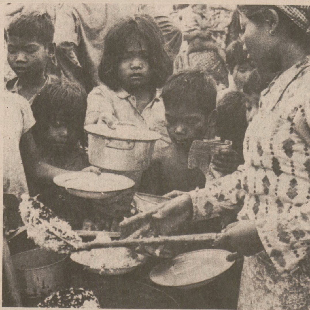
PREK PHNAU, KAMBODŻA. — Dzieci kambodżańskie otrzymują porcje ryżu od pracowniczeki Czerwonego Krzyża. W wyniku ofensywy komunistów tysiące rodzin uchodźców zostało bez dachu nad głową i środków do utrzymania.

Widownia obecna w studio była wyraźnie podzielona, — mniej więcej 50 proc. za wydaniem odpowiednich ustaw oraz drugie 50 proc. za utrzymaniem dotychczasowego stanu rzeczy jeżeli chodzi o kupno, sprzedaż czy produkowanie ręcznej broni palnej.