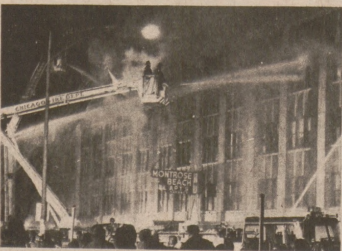
CHICAGO. — Strażacy walczą z gwałtownym pożarem, jaki nagle wybuchł 8 bm. w wielkim budynku, przeznaczonym na rozbórkę w północnej części miasta. Ogień prawdopodobnie został celowo podłożony przez wandalę.

Zaniepokojeni rodzice powiadomili policję, kiedy chłopiec nie wrócił ze sklepu.