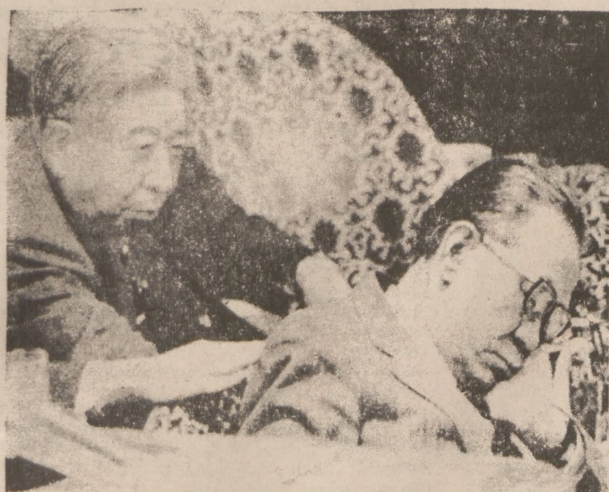
OKIO, JAPONIA — Premier Takeo Miki uciął sobie drzemkę w czasie omawiania przez japoński parlament budżetu. Naczelny Sekretarz Gabinetu, Ichitaro Ide, (po lewej) obudził jakoś premier, który udał się na filiżankę kawy, poczym wrócił na obrady.