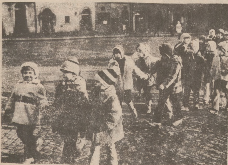
POLSKA. — Przedszkolacy spacerują po warszawskiej Starówce pod baczynym okiem (niewidocznej na zdjęciu) pani wychowawczynie.