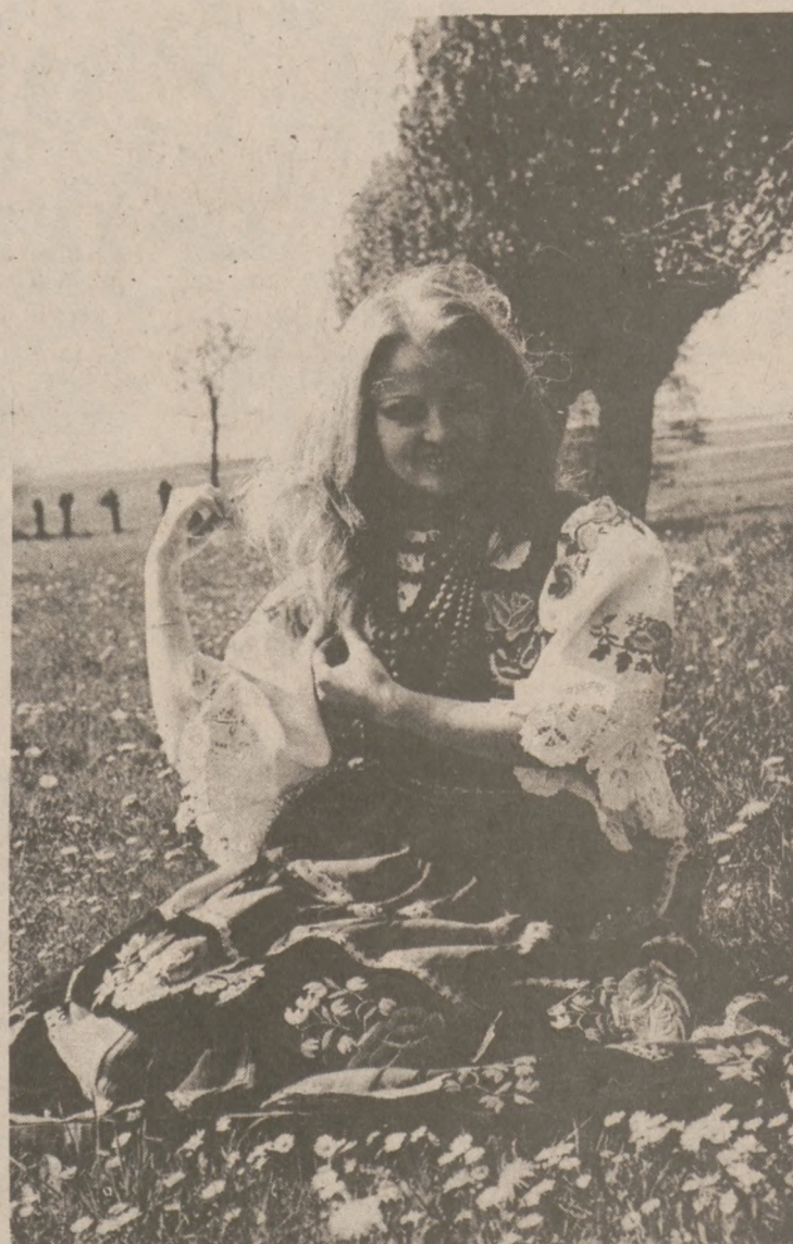
Polki słyną z urody w całym świecie, a najlepszym tego dowodem to ta uroczą Polka w stroju ludowym, na tle kwitnącej łąki.

Bricktown, N.J. (UPI). — Dwóch szantażystów wyłudziło $132,000 od zarządcy banku George J. Ritacco, po bankowym informowaniu go, że trzymają jego żonę jako zakładniczkę w jego domu. Ritacco zadzwonił do żony, która powiedziała mu, że jeden nieznajomy mężczyzna znajduje się w ich domu. Szantażyści zabrali do starożytności im przez Ritacco gotówkę i zbiegli.