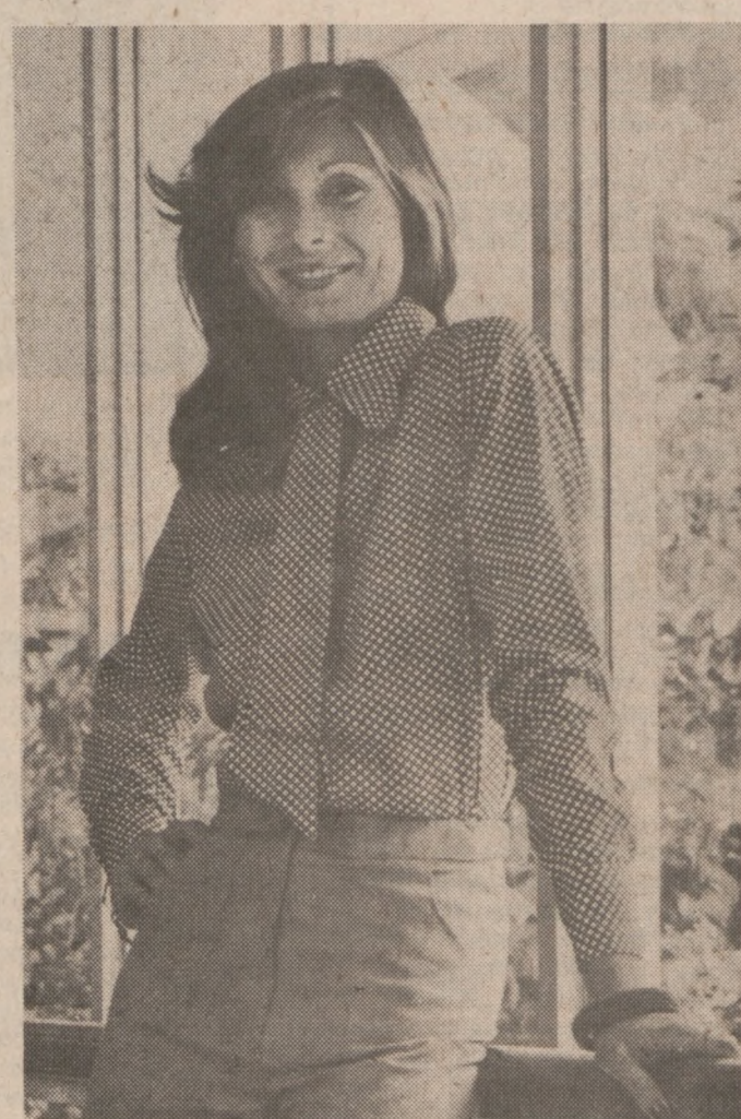
Modna bluzka z polyester. Długie rękawy i krawat z tego samego materiału.