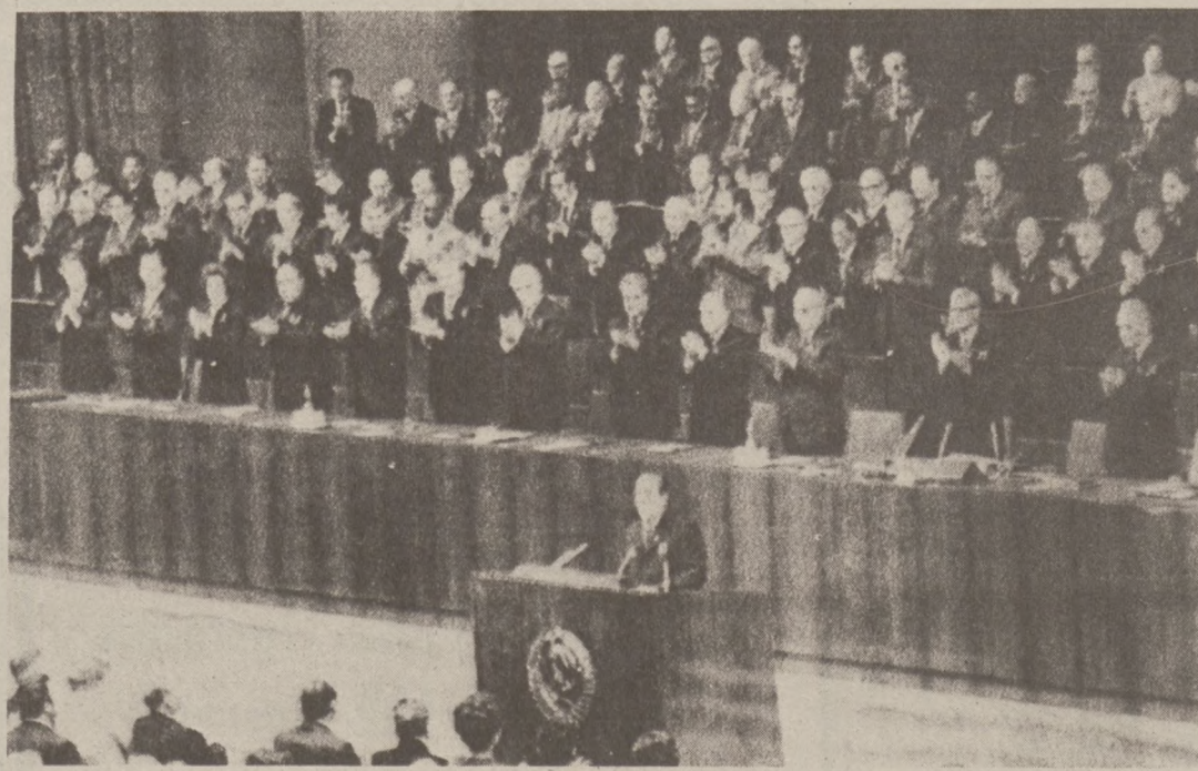
MOSKWA. — Leonid Breżniew wygłosił główne przemówienie podczas 25-go Kongresu Partii Komunistycznej w Moskwie.

Gubernator zaproponował $818 milionów na pokrycie kosztów utrzymania kampusów, co stanowi $36 milionów wzrost w porównaniu z wyznaczonymi funduszami ale jest o $57 milionów mniej od sumy żądanej przez komi-