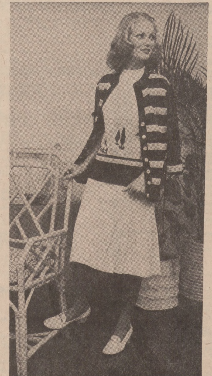
Efektowny komplet wiosenny z dzianej bawełny: spódniczka w kolorze białym, pulower biały z czarnym, sweter w pasy czarno białe.