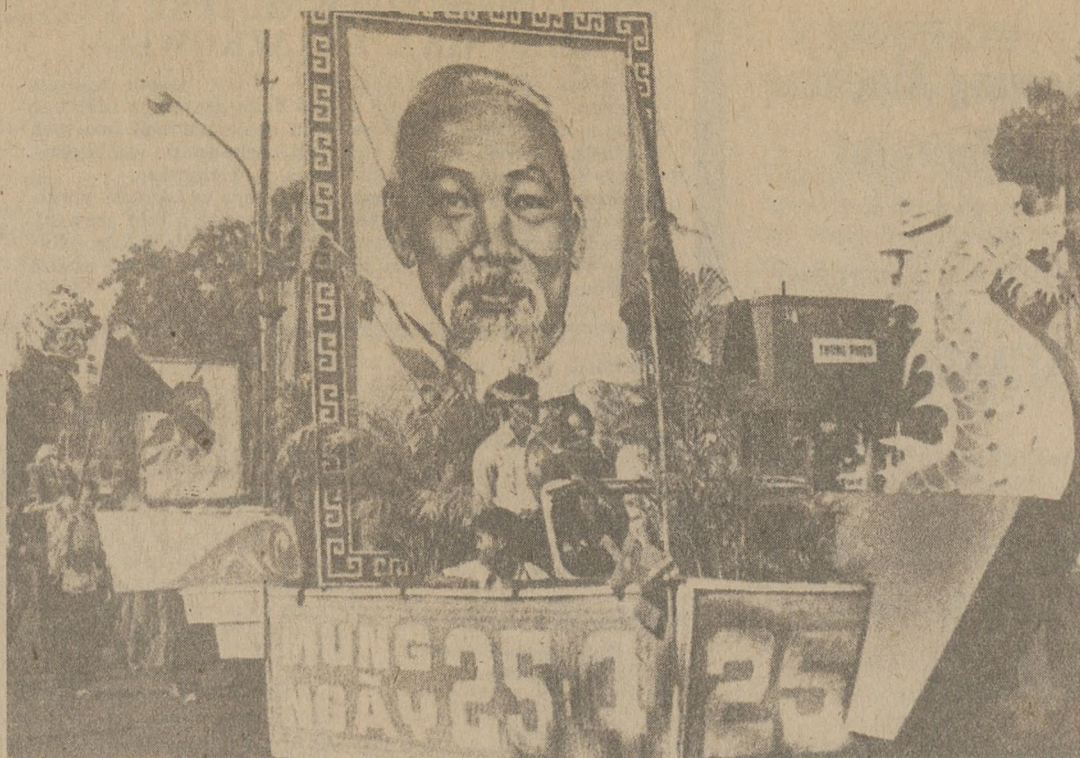
SAJGON, WIETNAM. Rydwan z olbrzymim portretem Ho Chi Minha na czele tłumy obliczanego na 10,000 w czasie parady w dniu wyborów w Sajgonie. Są to pierwsze generalne wybory od zakończenia Wojny Wietnamskiej.