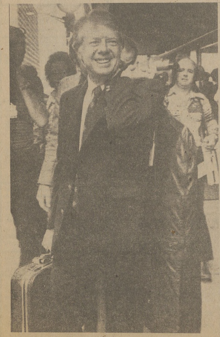
FILADELFINIA. Rozpromieniony Jimmy Carter opuszcza hotel w drodze na konferencję prasową. Carter ma nadzieję zjednoczenia Partii Demokratycznej i zwrócił się o poparcie sen. Huberta H. Humphreya.